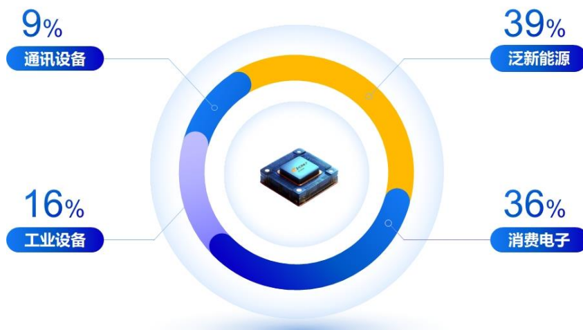
图 1：2024 年上半年公司产品与方案板块下游终端应用情况

公司在光伏逆变器、变频器等新能源领域加大客户拓展力度，市场份额提升，产品进入阳光电源、德业股份、汇川等重点客户，泛新能源领域在公司产品与方案板块占比达到了 39%。