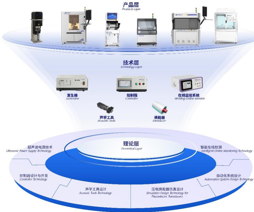
公司超声波技术平台

依靠公司全面的基础研发技术，公司自主研发的一体式楔杆焊接技术、超声波金属焊接质量监控技术和超声波高速滚焊系统技术等核心创新技术达到了国际先进水平。公司主要核心技术的具体情况如下：