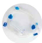
体外循环管路 (静脉管路)