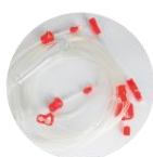
体外循环管路 (动脉管路)