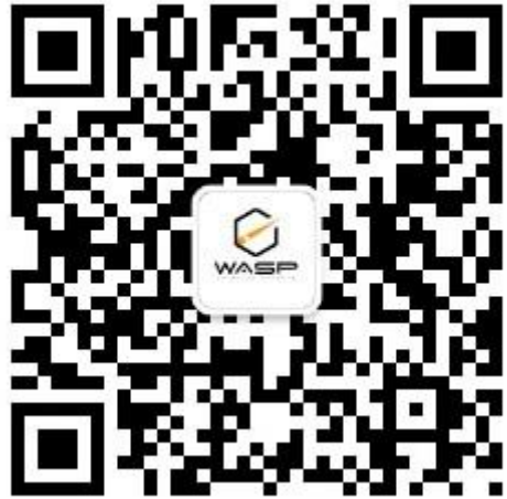
黄蜂 T800 多场景智能制暴器及产品公众号