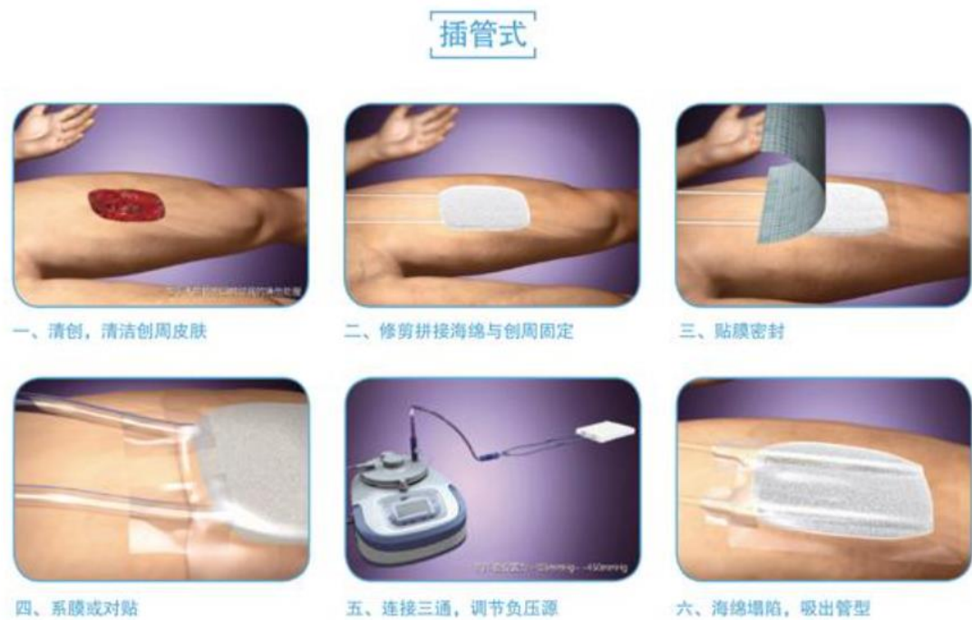
图 4 封闭创伤负压引流套制备过程