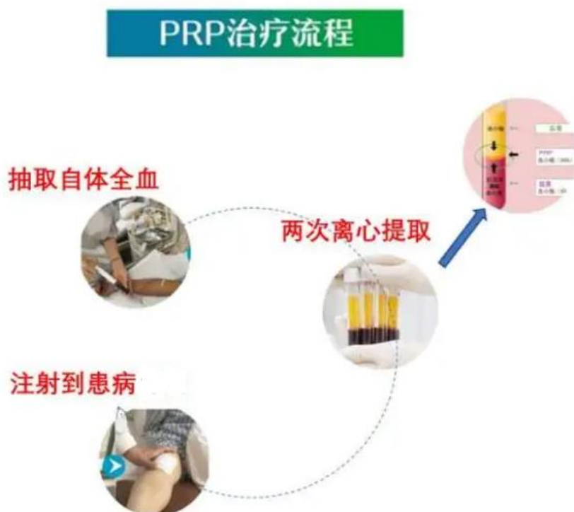
图 2 富血小板血浆（PRP）制备用套制备过程