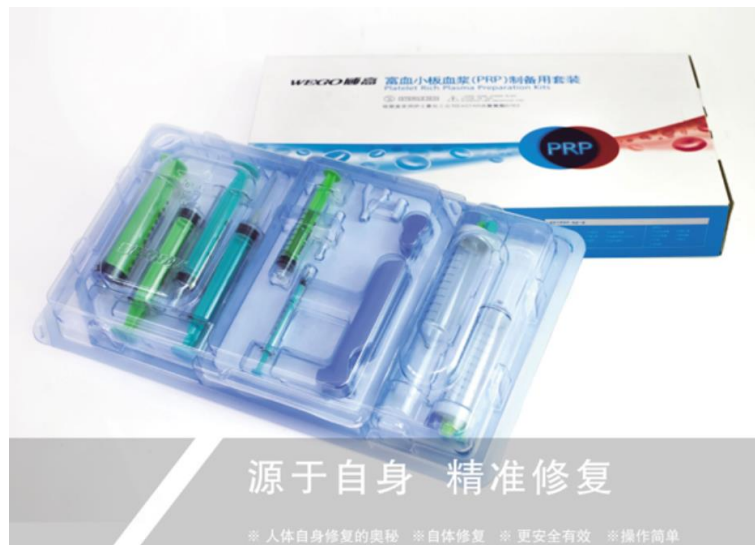
图 1 富血小板血浆（PRP）制备用套装产品示意图

富血小板血浆（PRP）制备用套装为第三类医疗器械，经过国家药品监督管理局注册审批上市。