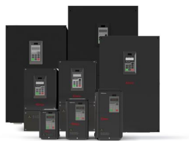
图 5：低压变频器产品