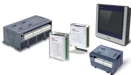
图 2：可编程逻辑控制器产品