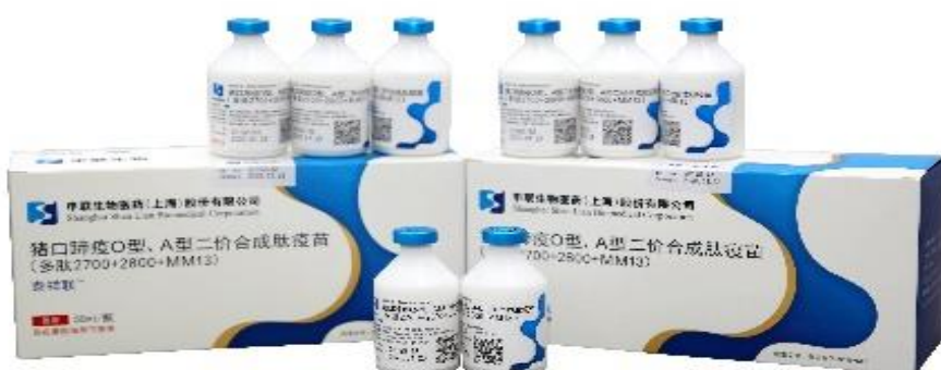
猪口蹄疫 O 型、A 型二价合成肽疫苗 (多肽 2700+2800+MM13)