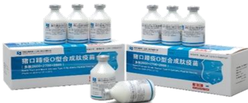
猪口蹄疫 O 型合成肽疫苗 (多肽 2600+2700+2800)