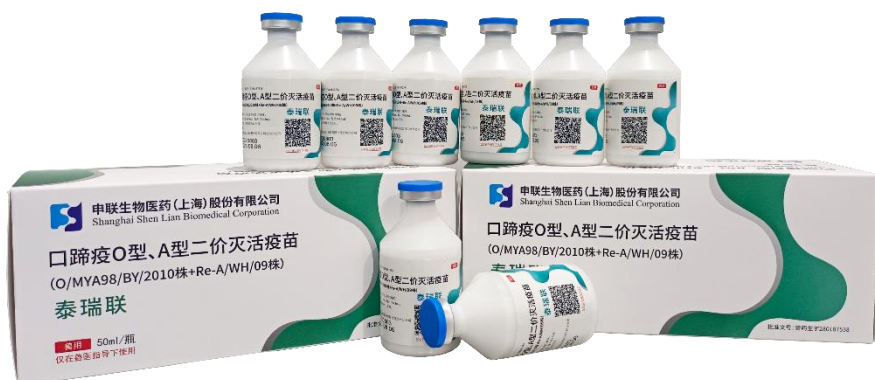
口蹄疫 O 型、A 型二价灭活疫苗 (O/MYA98/BY/2010 株+Re-A/WH/09 株)