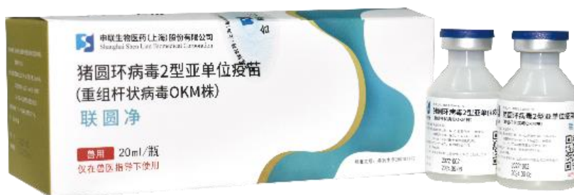
猪圆环病毒 2 型亚单位疫苗 (重组杆状病毒 OKM 株)