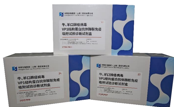
牛、羊口蹄疫病毒 VP1 结构蛋白抗体酶联免疫吸附试验诊断试剂盒