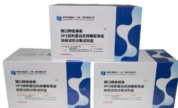
猪口蹄疫病毒 VP1 结构蛋白抗体酶联免疫吸附试验诊断试剂盒