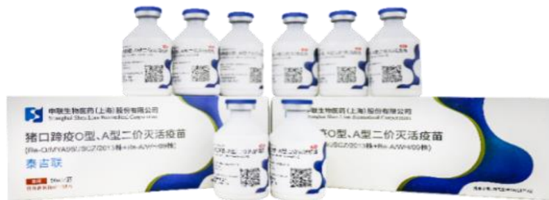
猪口蹄疫 O 型、A 型二价灭活疫苗（Re-O/MYA98/JSCZ/2013 株+Re-A/WH/09 株）

公司主要产品为系列口蹄疫疫苗、猪圆环病毒 2 型亚单位疫苗（重组杆状病毒 OKM 株）及系列兽用诊断制品。系列口蹄疫疫苗包括猪口蹄疫 O 型、A 型二价灭活疫苗（Re-O/MYA98/JSCZ/2013 株+Re-A/WH/09 株）、牛羊用口蹄疫 O 型、A 型二价灭活疫苗（O/MYA98/BY/2010 株+Re-A/WH/09 株）、猪口蹄疫 O 型、A 型二价合成肽疫苗（多肽 2700+2800+MM13）和猪口蹄疫 O 型合成肽疫苗（多肽 2600+2700+2800）等。系列兽用诊断制品包括猪口蹄疫病毒 VP1 结构蛋白抗体酶联免疫吸附试验诊断试剂盒、牛、羊口蹄疫病毒 VP1 结构蛋白抗体酶联免疫吸附试验诊断试剂盒和非洲猪瘟病毒荧光 PCR 核酸检测试剂盒。