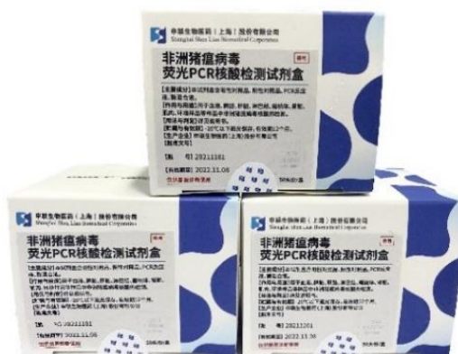
非洲猪瘟病毒荧光 PCR 核酸检测试剂盒