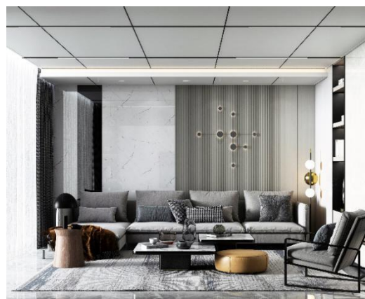
集成吊顶（客厅、卧室）