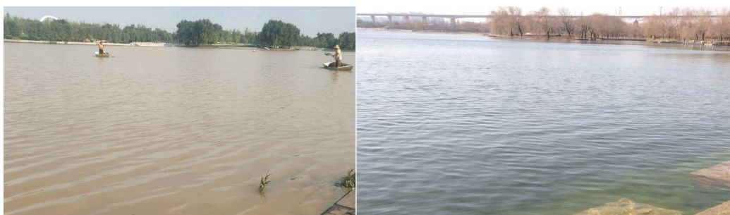
蝶湖公园暴雨灾后水系生态遭破坏