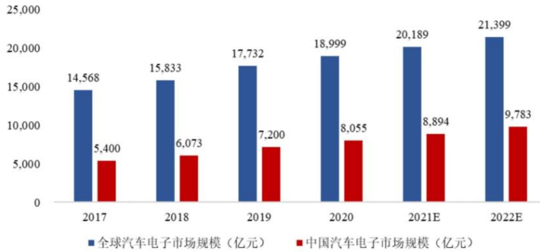
2017年至2022年全球和中国汽车电子市场规模（含预测）

动汽车电动化、网联化、智能化方面发挥着至关重要的作用。近年来，国务院、国家发改委等相关部门相继出台《汽车产业中长期发展规划》、《智能汽车创新发展战略》及《关于加快培育发展制造业优质企业的指导意见》等多项行业扶持政策及指导意见，明确支持我国要引导创新主体协同攻关整车及零部件系统集成、先进汽车电子、关键零部件模块化开发制造、核心芯片及车载操作系统等关键核心技术，极大推动了我国汽车电子行业的良性发展。