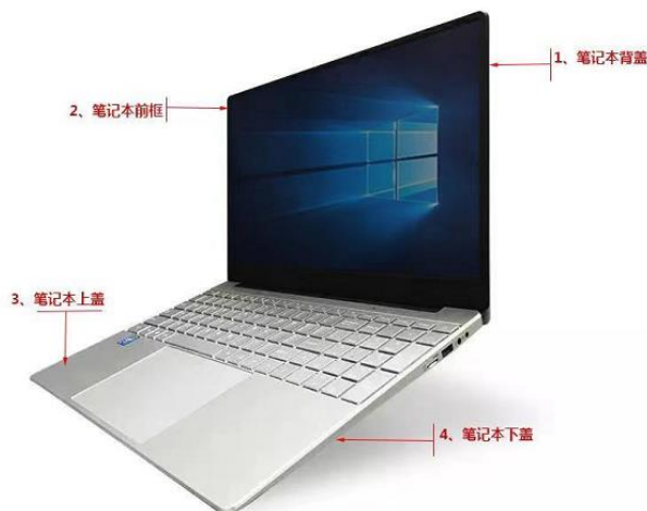
图：笔记本外壳示意图

公司为主流消费电子产品厂商提供精密结构件模组产品，其中以笔记本电脑结构件模组为主。笔记本电脑结构件模组包括四大件：背盖、前框、上盖、下盖以及金属支架，上述结构件模组在装配笔记本电脑过程中需容纳显示面板、各类电子元器件、转轴等部件，其结构性能对制造精密度提出了较高的要求。同时由于其还具有外观装饰功能，故该产品对生产企业的设计能力亦有较高的要求。