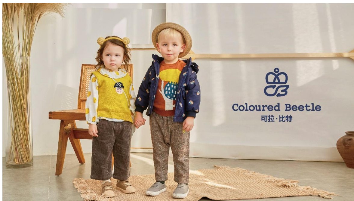
可拉·比特形象大片

“Coloured Beetle 可拉·比特”品牌是专为新生代的婴幼儿童打造的一站式外出服品牌，核心目标客群为0-6岁婴幼儿童，致力于满足对婴幼儿童服装兼具实用性和时尚度的85-90后年轻父母的要求。品牌定位中高端，以线下母婴渠道、婴幼连锁为主要销售平台，以具有品味的产品设计，引导小朋友从小树立自然、环保、有品位的意识。“Coloured Beetle 可拉·比特”品牌系上海蛙品儿童用品有限公司旗下婴幼儿童品牌。