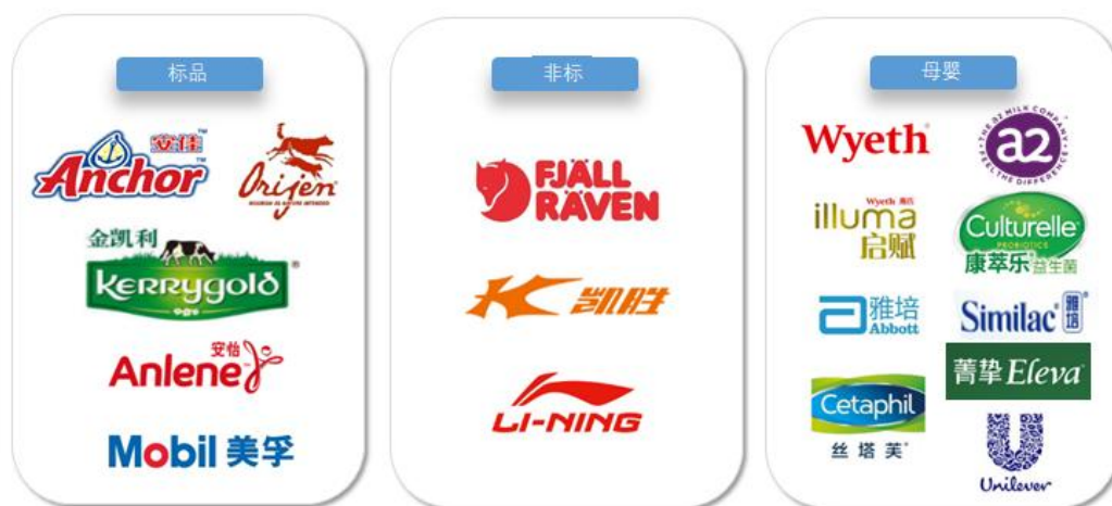
礼尚信息核心服务品牌