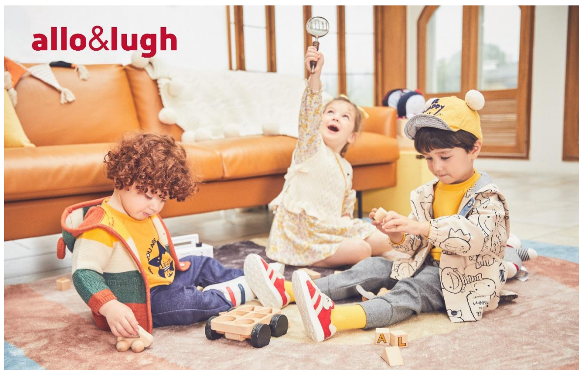
ALLO&LUGH 阿路和如形象大片