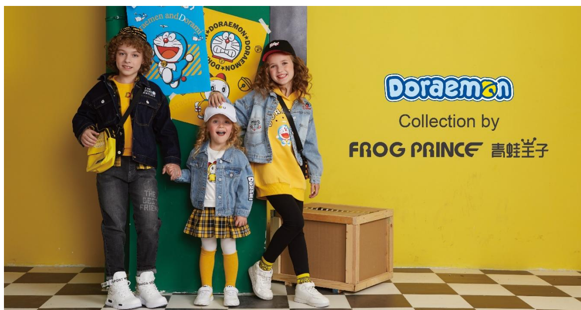
青蛙王子形象大片

“FROG PRINCE 青蛙王子”是中国十大童装品牌之一，拥有超过 20 年的品牌发展历程，核心客群为 0—16 岁的大小童，致力于满足孩子们在学校、假日、派对、休闲游玩等不同场合的穿着，赋予孩子自信、积极、向上的穿着方式。“FROG PRINCE 青蛙王子”产品分为文艺、休闲、运动三大系列，全面覆盖 0-16 岁儿童的服装、童鞋、配饰等全品类。“FROG PRINCE 青蛙王子”系上海蛙品儿童用品有限公司旗下童装品牌，公司于 2018 年 12 月、2019 年 9 月、2020 年 2 月通过股权转让及增资的方式累计持有其 50% 的股权。