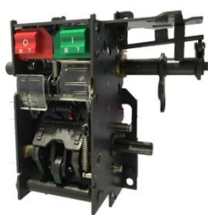
低压断路器操作机构

公司主营业务为高、低压断路器关键部附件、智能环网柜及其关键部附件的研发、生产和销售，是目前我国高、低压断路器关键部附件和智能环网柜及其关键部附件行业中研发、生产、服务能力位于前列的企业之一。公司产品主要用于电力系统的配电设施，包括低压及中高压断路器配套用框（抽）架、操作机构、附件和智能环网柜及智能环网柜的断路器单元操作机构及开关、负荷开关单元操作机构及开关、组合电器单元操作机构及开关等。