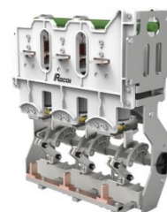
环网柜断路器单元开关