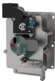
环网柜负荷开关单元操作机构