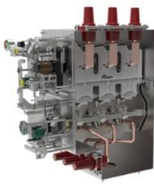
环网柜断路器单元气箱