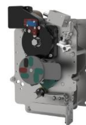
环网柜组合电器单元操作机构