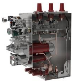
环网柜组合电器单元气箱