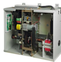
中高压断路器操作机构