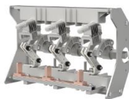
环网柜负荷开关单元开关