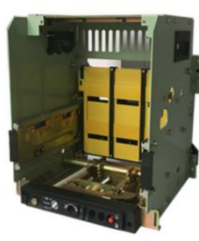
低压断路器框（抽）架