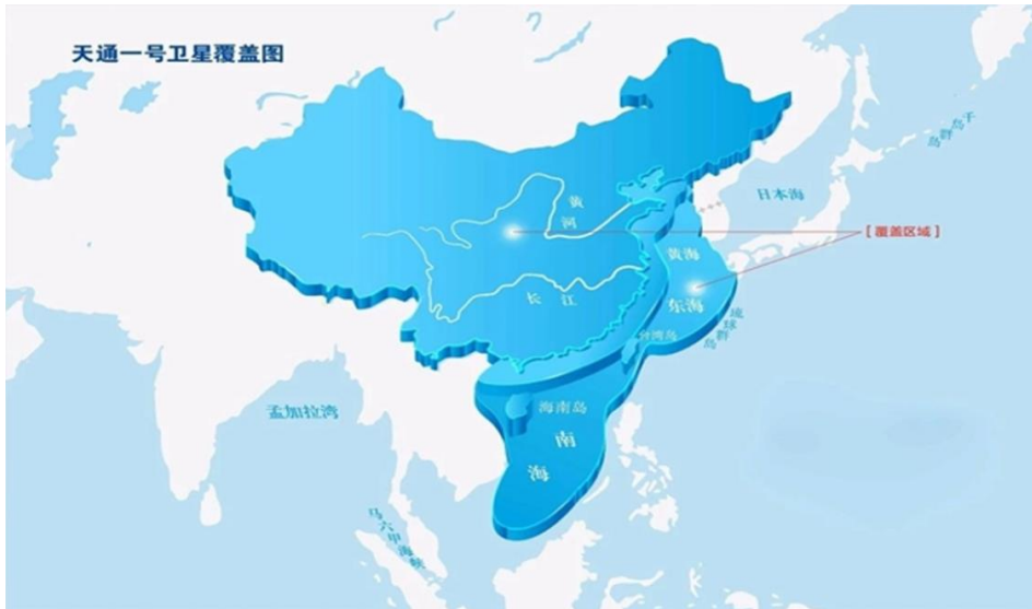
天通一号星覆盖范围图