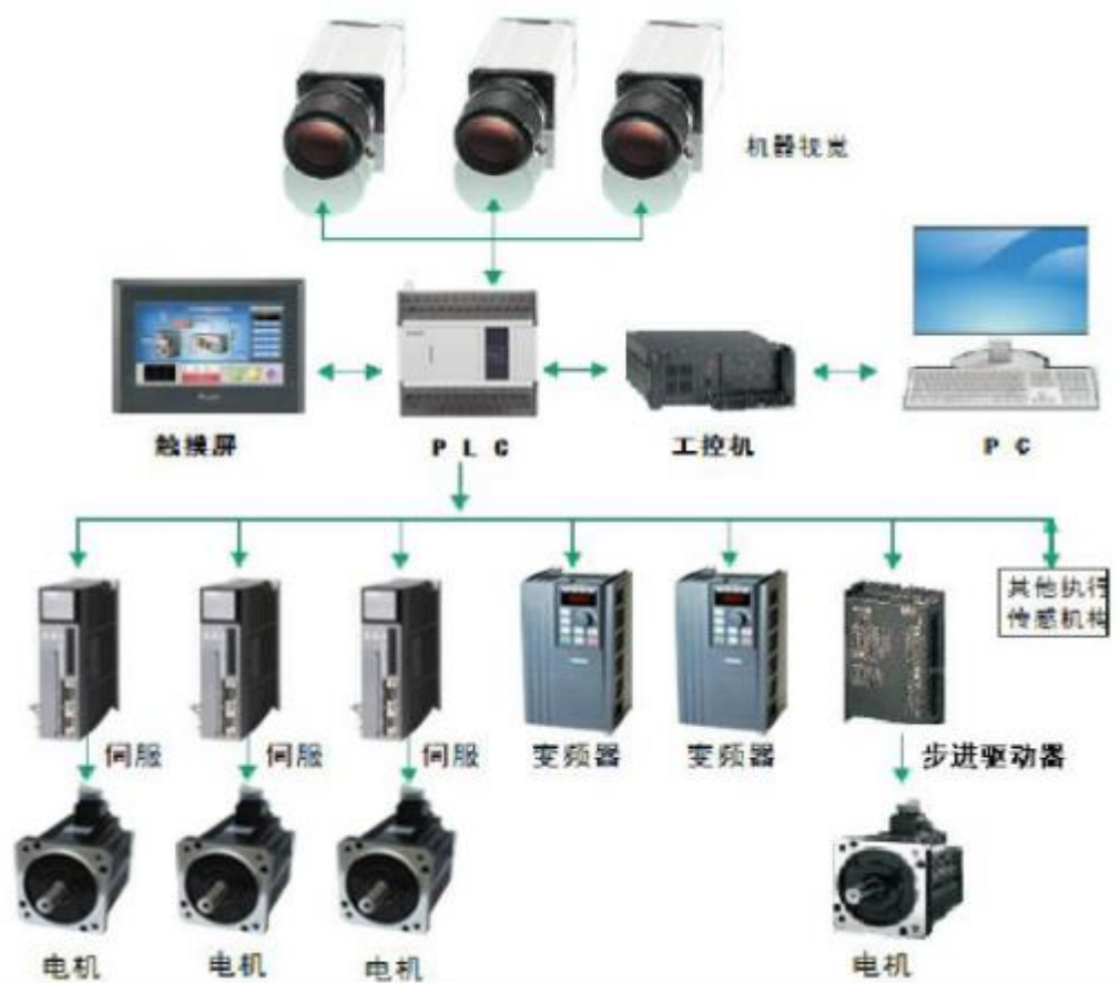
公司整体工控自动化解决方案示意图