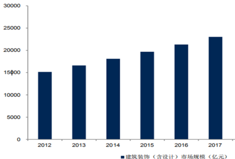
我国装修装饰(含设计)市场规模变化情况

水平的提高及对室内设计及装修的需求日益扩大,建筑装饰行业的市场规模逐步增加。根据弗若斯特沙利文报告,2012年至2018年期间,我国建筑装饰(含设计)行业的市场规模(按收入计算)从约15,000亿元增长至约25,000亿元,年复合增长率接近9%,预计到2020年市场规模将达到约29,000亿元。