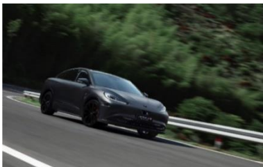
阿尔法 S 全新 HI 版