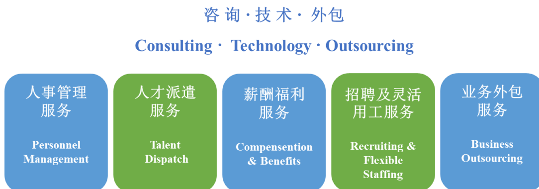
图：上海外服主营业务构成情况

上海外服核心主营业务包括人事管理服务、人才派遣服务、薪酬福利服务（包括薪税管理服务、健康管理服务和商业福利服务）、招聘及灵活用工服务、业务外包服务等，实现了人力资源细分市场服务解决方案的全覆盖。上海外服拥有一大批经验丰富的人力资源专家型顾问，针对客户多样化、个性化的人力资源服务需求，以“咨询+技术+外包”高附加值业务模式，为各类客户提供融合本土智慧和全球视野的全方位人力资源解决方案。