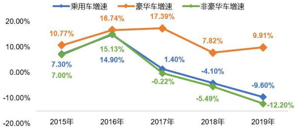
全国乘用车与豪华车、非豪华车近5年增速对比