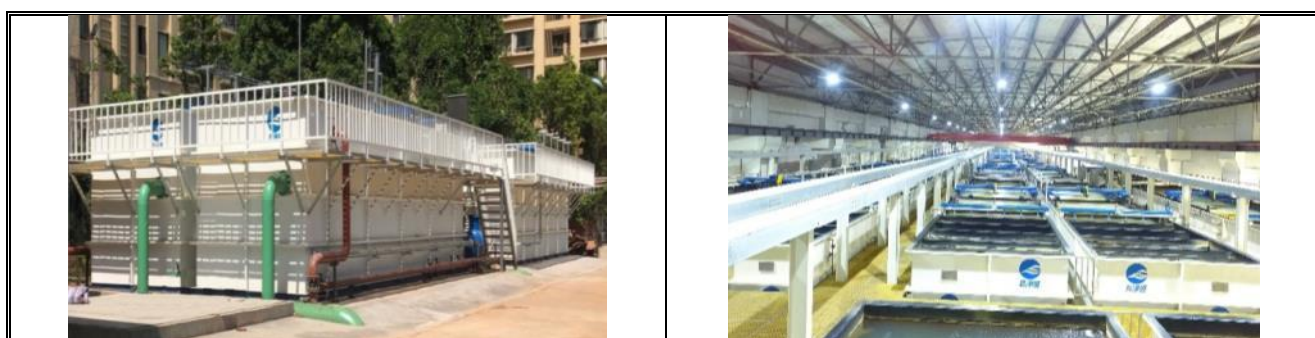
孢子转移系统实景图

孢子转移系统的技术特点及优势： 孢子转移系统通过溶气系统、稳态流动场、定制化药剂、药剂准确投加、内源污染控制等方面进行系统创新，具有超极限除磷、饱和溶解氧出水、药剂残留低等优势。