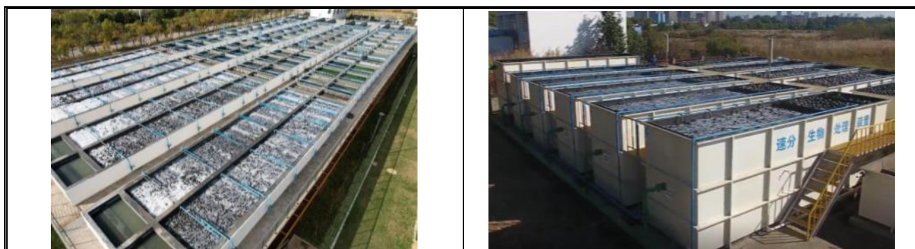
速分生物处理系统实景图

速分生物处理系统的技术特点及优势： 速分生物处理系统通过进水关键指标的判断与控制、模块化水量匹配设计、定制化速分球、稳态流动场、多功能曝气系统等方面进行系统创新，具有污染物去除效率高、超极限脱氮、耐水质及水量冲击、耐低温、剩余污泥原位减量、适于微污染水处理等优势。