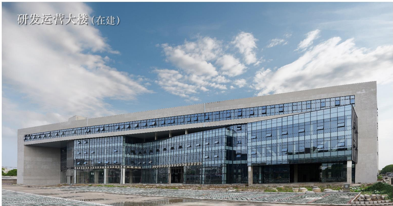
研发运营大楼(在建)