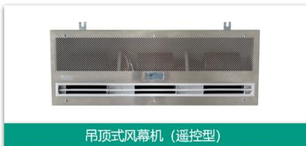
吊顶式风幕机（遥控型）