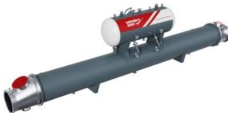
卧式布置余热锅炉