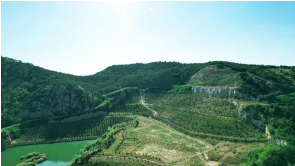
图 3：青岛市即墨区某废弃矿山修复前后对比