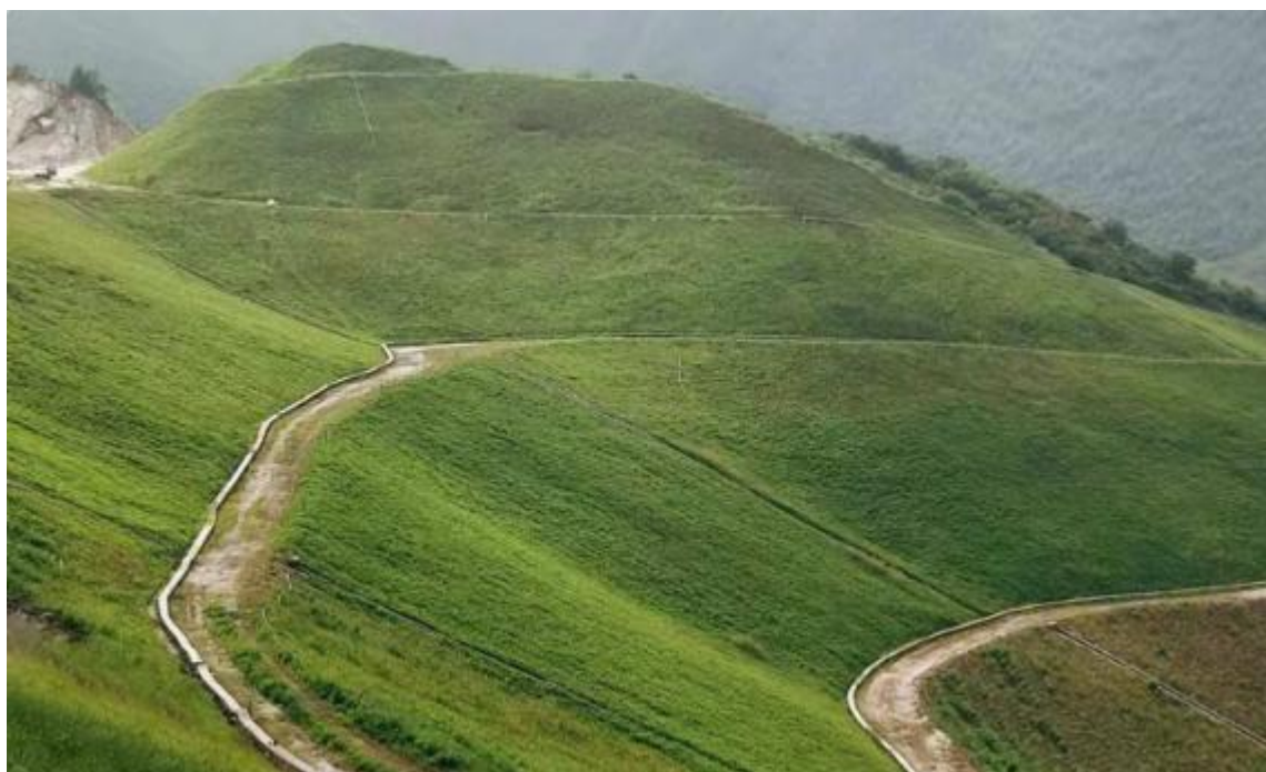
图 1：辽宁海城某矿山修复前后对比

自然环境生态修复为公司的主导业务，秉承“为环境服务”的理念，使待修复区域恢复或具备自然环境应有的生态功能和生态结构，并能持续健康演替发展。该业务依托公司独特的生态修复系列技术（如团粒喷播植被恢复技术和优粒土壤制备工艺等）展开，业务覆盖矿山生态环境治理，荒漠化、石漠化和水土流失综合治理，道路边坡等基础设施修建区生态修复，及部分海域、海岸带和海岛综合整治，河流、湖泊与湿地修复，污染场地治理等。尤其是针对土壤瘠薄或者根本没有土壤（如裸岩边坡）、水土流失问题严重、风沙大、气温低、无霜期短等立地条件特别恶劣的待修复区域，公司可以实现快速、规模化造林，且修复区域内的新建植物群落与原生植被呈现自然融为一体的效果，人工痕迹极少，解决了传统的、常规的绿化技术手段适用修复范围小和修复效果差的难题。公司近年来通过土壤改良、植物配置和工艺与装备等方面的持续创新提升，不断拓展技术应用场景，发力细分市场，形成了几大优势拳头业务即高寒高海拔区域、湿陷性黄土区域、各种岩质矿山、污染严重矿山和尾矿坝以及人工（无人）岛礁等的生态修复。报告期内，公司实施的上述典型项目主要有淄博四宝山区区域生态建设综合治理项目—水体生态修复项目、乐平市废弃矿山生态修复综合治理项目（一期）、建水县历史遗留矿山生态修复项目勘查设计施工总承包、民和祁连山水泥有限公司二北沟石灰石矿矿山边坡喷播项目、东平县九女泉关停矿山生态修复总承包项目团粒喷播工程、秦岭北麓华州区矿山地质环境恢复治理工程（原华州区陕西文金栗峪矿业有限公司历史遗留矿山）施工（一标段）等。