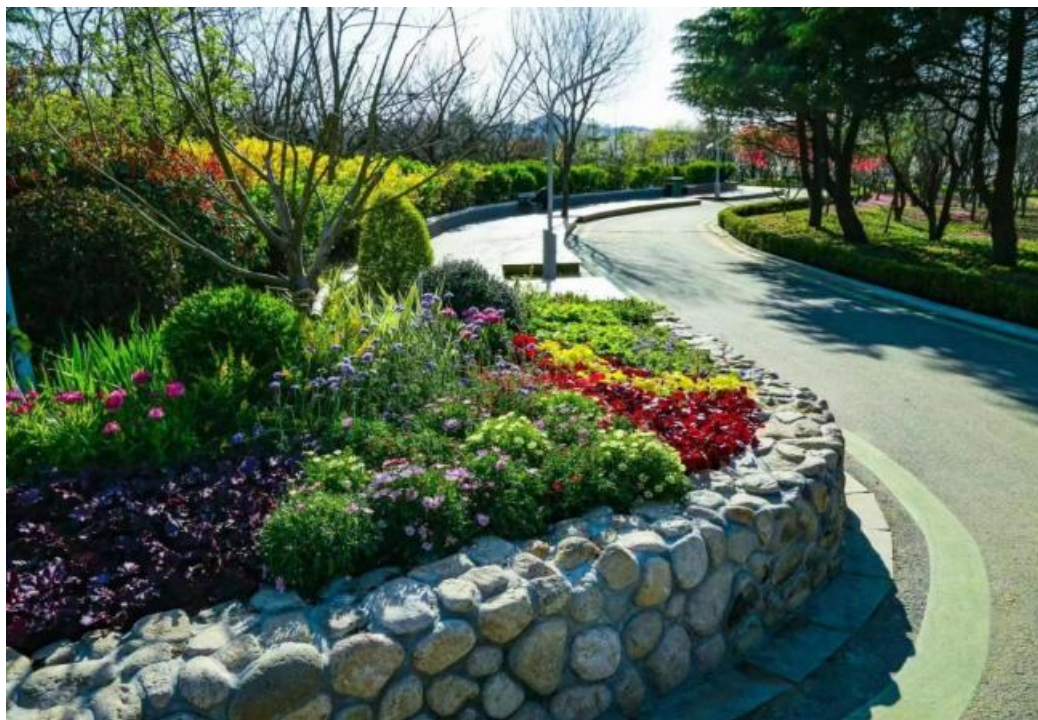
图 2：青岛市市北区浮山绿道项目完工效果

公司以技术拓展应用促进产业链条延长，以引进专业团队促进业务板块拓展，报告期内土壤环境监测、育苗销售、生态修复治理工程设计方案编制业务等落地了小批量订单，为公司贡献了新的利润增长点。