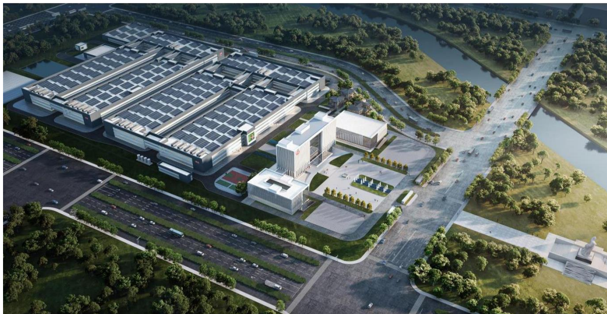
南阳仲景食品产业园一期项目效果图

公司未来将形成生产基地西峡-南阳，营销研创郑州-上海的跨越式发展布局，为可持续稳定发展奠定坚实的基础。