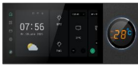
6吋智慧家庭中控屏Knob