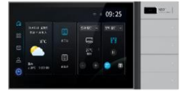
7吋智慧家庭中控屏Neo