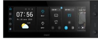
7.8吋智慧家庭中控屏Pro