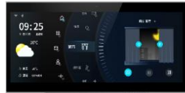
10吋智慧家庭中控屏Spuer