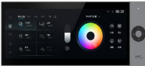
12吋智慧家庭中控屏Slim