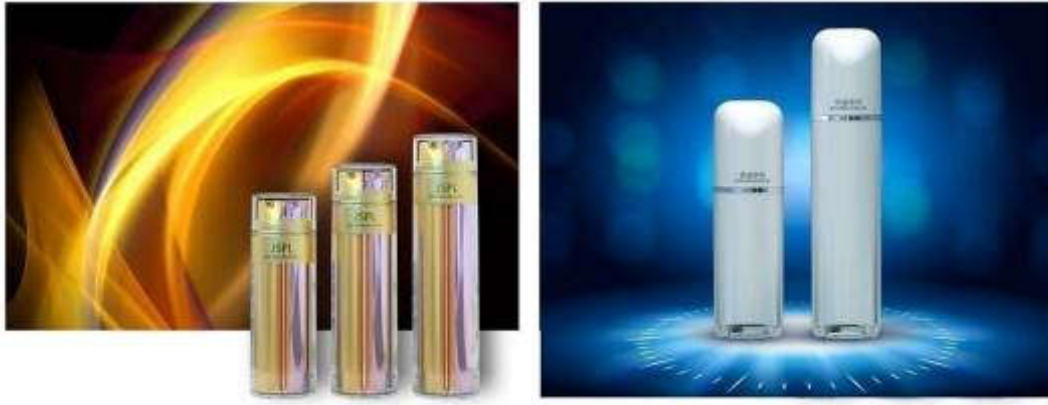
乳液瓶系列产品示意图