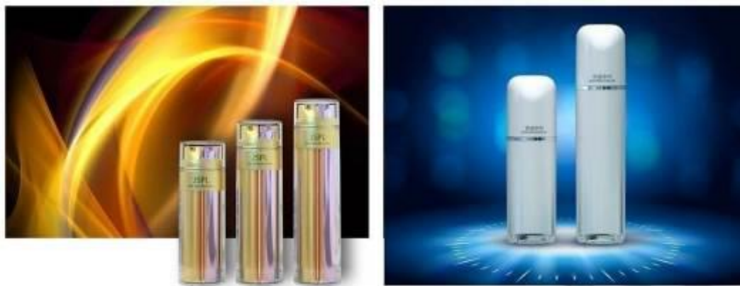
乳液瓶系列产品示意图