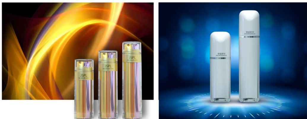
乳液瓶系列产品示意图