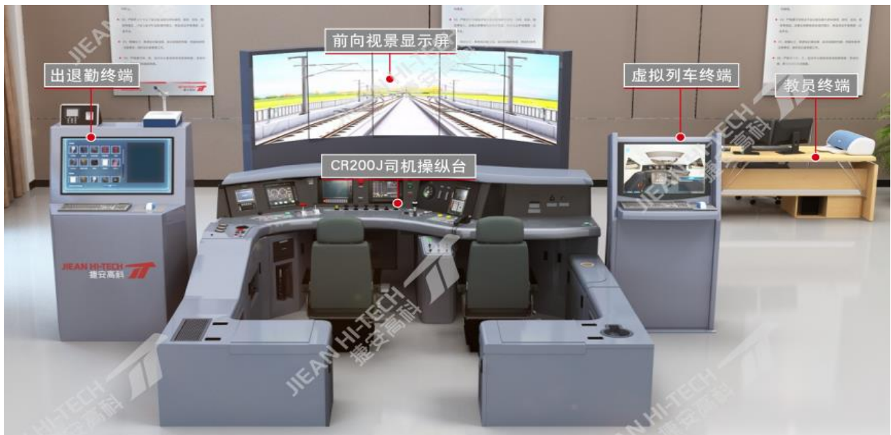
高铁复兴号集成式仿真实训系统

城市轨道交通仿真实训系统产品可应用于地铁、轻轨、有轨电车和磁悬浮等城市轨道交通工具的仿真实训活动。已开发车辆、运营管理、机电、通信信号、供电、检修等系统产品。覆盖了城市轨道交通重要岗位的作业技能教学、练习和考核。