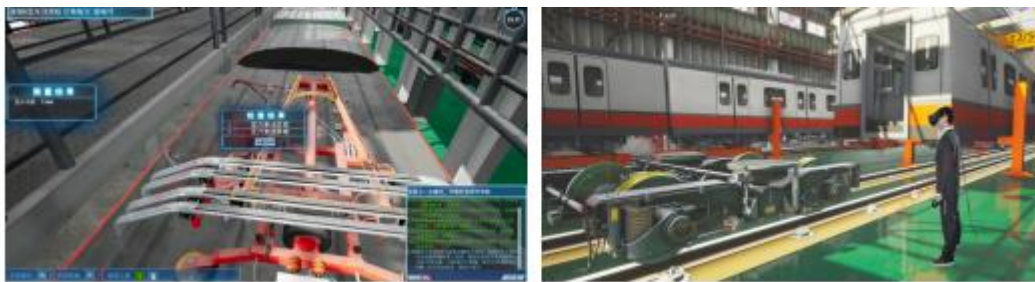
城市轨道交通车辆检修仿真实训系统