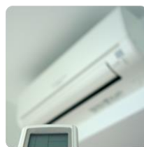
高档电器、器具外壳