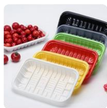
挤出板材（食品接触用产品）

型新材料，属于国家战略性新兴产业重点产品，具有较高的市场知名度和市场认可度，也是公司的主要利润来源。“高抗冲聚苯乙烯”广泛的应用场景如下图所示：