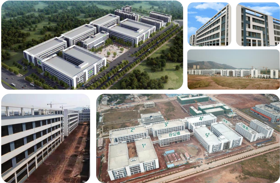
图 1 贝仕达克广东河源科技园（效果图及实景）