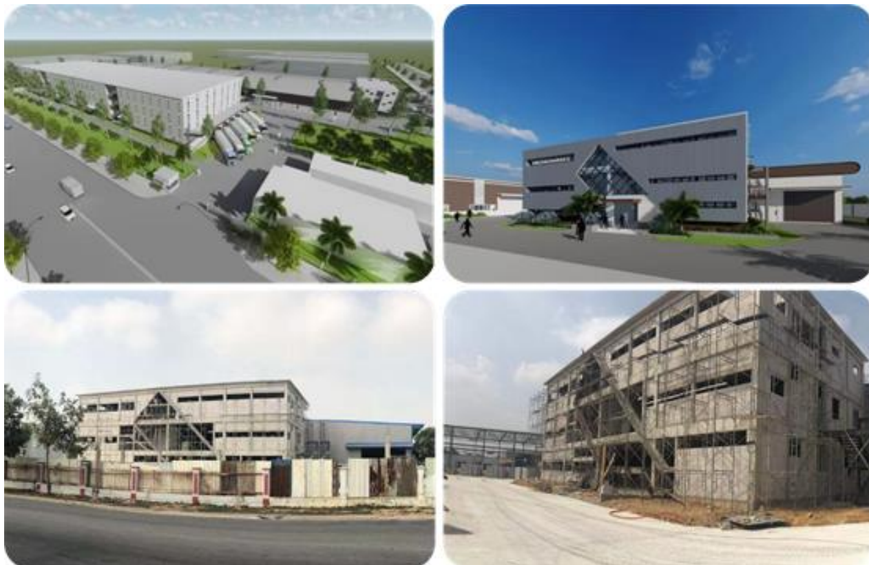
图 3 越南伯仕自建厂房（效果图及实景）

证书文件，土地面积为32,545平方米。目前越南平阳生产基地目前已正式开工建设，公司对越南持续加大投资力度，进一步扩增产能，标志着贝仕达克全球供应链布局的进一步深化及全球化业务辐射功能的进一步升级。项目达产后，将提升公司智能控制器海外产能，更好的满足海外市场客户需求。公司将继续充分发挥技术和服务优势，实现国际业务和服务网络的整合，为全球更多的优质客户带来领先的产品及一流的服务。