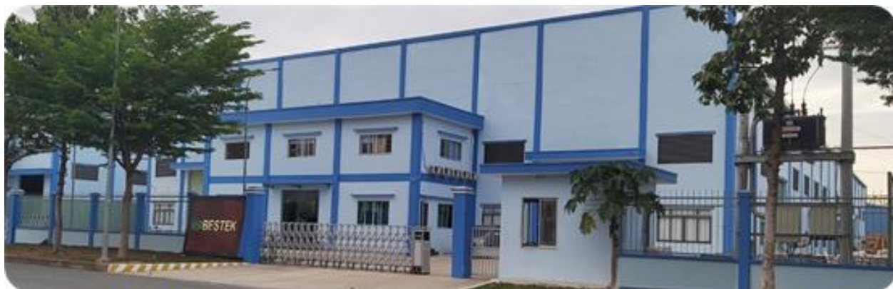
图 4 越南伯仕现有生产基地