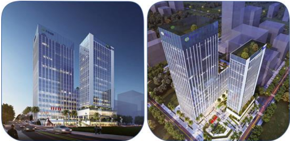
图 2 贝仕达克新一代智能控制器深圳产业基地（效果图）

2020年12月10日公司成功竞得深圳市龙岗区宝龙街道宗地号为G02304-0009的宗地使用权，拟在深圳投建新一代智能控制器产业基地，项目总规划建设用地面积为8,010.53平方米，致力于打造集研发、生产等功能于一体的平台，以强化公司优势资源协同，加快产品、市场、业务三大结构优化，进一步提升公司的核心竞争力。目前项目已完成初步规划方案，预计2021年内启动开工准备。