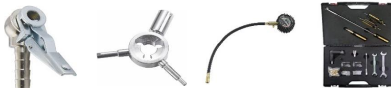
不同种类的轮胎用品