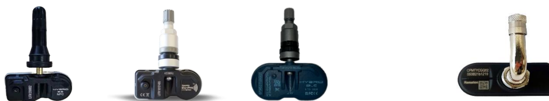
汽车用TPMS（左三为蓝牙）

2、TPMS 传感器及配件。TPMS 产品主要监测轮胎的压力、温度、加速度等数据，通过射频信号将数据传输到接收机，并在车辆显示器上显示各种数据变化。TPMS 可以在车辆出现轮胎偏离标准胎压、温度超标、快速漏气等安全隐患时进行报警，以保障行车安全，是车辆主动型安全防护装置。按安装阶段分，TPMS 分为前装传感器和售后传感器，前装传感器主要为整车厂供货，售后传感器主要通过零售端销售给汽车维修商、4S 店和轮胎供应商。在前装市场，公司已成为上汽集团、北汽集团、长安汽车等整车厂 TPMS 产品的一级供应商；新开发的摩托车 TPMS 产品已为春风动力、隆鑫摩托等客户 OE 配套。在售后市场，公司针对欧洲、北美、中国等不同市场开发出多款不同功能和种类的可编程 TPMS 传感器，覆盖率达到 95% 以上车型，并在使用终端能实现传感器在线升级。针对售后市场 TPMS 传感器需专业工具编程才能使用的痛点，开发出行业内首个基于近场通信的配置 NFC 功能的传感器，通过手机、平板、PC 可以对其进行直接编程，抛开了专业工具的束缚，具备编程速度快、抗干扰、体验好、操作简单等优点。新开发的低功耗蓝牙 TPMS 产品已于 5 月下旬在意大利博洛尼亚汽配展和德国科隆轮胎展展出，将首先投放欧洲冬季胎市场。