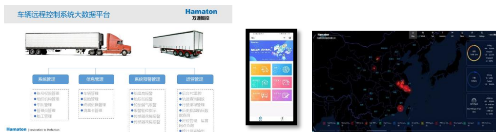
“智汇万通”车联网远程信息管理系统

在PPM传感器的基础上，公司开发了能接收PPM信号的T-Box和“智汇万通”管理软件，组成了车联网远程信息管理系统，主要服务于商用车车队管理的市场需求。随着车辆智能化、网联化的发展，商用车车队对于安全出行、车辆维护和管理的需求日益提高。公司在多年的胎压传感器技术基础上，结合射频技术、通讯终端技术和车队管理软件集成专业的车队管理系统。以T-Box为车队管理通讯平台，以包括TPMS在内的各种无线传感器为通讯终端，将数据集成后传输给车辆和云端，为驾驶员和车队管理者提供信息服务，解决车队管理痛点，实现车队的智能化管理。公司在欧洲的商用车研发中心，正着力研究开发液位传感器，空气过滤传感器，刹车盘传感器等各种无线传感器，不断完善车联网远程信息管理系统。目前，可口可乐、亚马逊等美国商用车队已开始批量安装使用公司产品。由于T-Box能兼容FSK和PPM等不同通讯方式，可以帮助客户集中管理不同的传感器数据，为客户带来更大的使用价值。