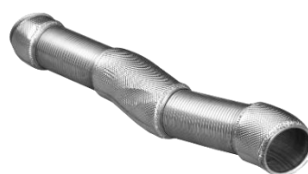
气密金属软管总成