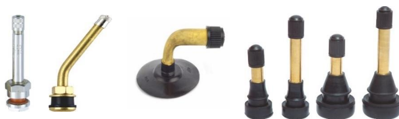
不同种类的轮胎气门嘴

4、气门嘴及轮胎用品，包括各种气门嘴及配件、轮胎及气门嘴安装和修补工具、气压测量工具等。气门嘴是轮胎的充放气的阀门，从产品结构上看，可分为卡扣式气门嘴、压紧式气门嘴及胶座气门嘴等，适用于不同的车辆轮胎。公司的气门嘴产品品类齐全、质量可靠，在TÜV安全认证环境下生产，主要供应北汽、上汽、通用、东本、东风汽车等主机厂，与中策集团、固特异、Haltec等汽车零部件一级供应商保持长期稳定的业务关系。