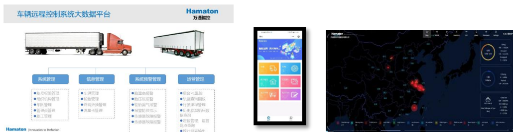
“智汇万通”车联网远程信息管理系统

T-Box 集成了 PPM 和 FSK 信号接收，支持伽利略及基站定位，实现了远程在线升级，支持蓝牙 5.0。PPM 传感器具有功耗低，寿命长，传输速率高，防撞帧，体积小，便于安装等优点，在标准胎压传感器的基础上，成功开发系列产品，如 OTR 传感器（主要用于工程车辆）；延长杆传感器（适用于双胎的安装）；自动充放气传感器等。公司自主开发的“智汇万通”车辆远程信息管理系统，基于 T-BOX 数据，可以实现车辆定位，实时监控，轮胎管理等多种功能。