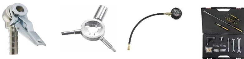
不同种类的轮胎用品