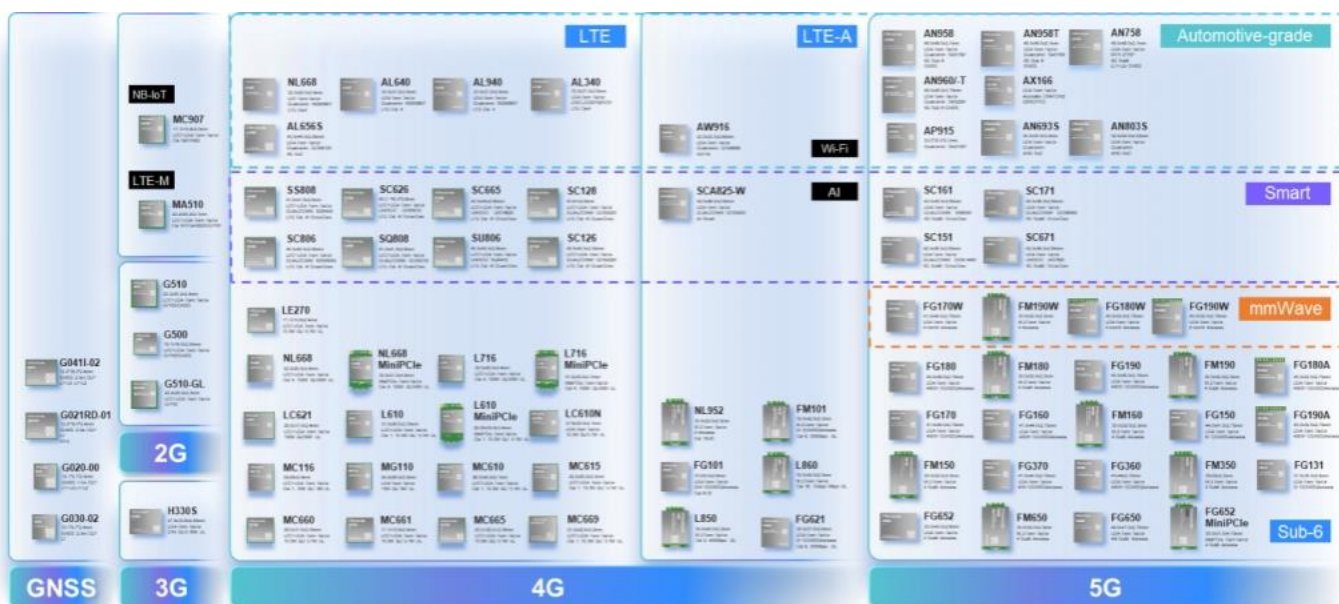
图 2：公司主要产品图片

公司自成立以来一直致力于物联网与移动互联网无线通信技术和应用的推广及其解决方案的应用拓展，在通信技术、射频技术、数据传输技术、信号处理技术上形成了较强的研发实力，是无线通信技术领域拥有自主知识产权的专业产品与方案提供商。公司在物联网产业链中处于网络层，并涉及与感知层的交叉领域，主要从事无线通信模块及其应用行业的通信解决方案的设计、研发与销售服务。