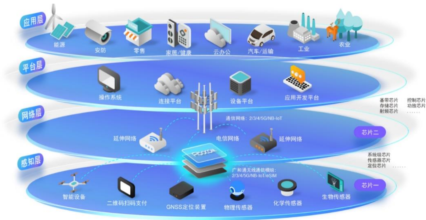
图 1：物联网产业链及架构

公司自成立以来一直致力于物联网与移动互联网无线通信技术和应用的推广及其解决方案的应用拓展，在通信技术、射频技术、数据传输技术、信号处理技术上形成了较强的研发实力，是无线通信技术领域拥有自主知识产权的专业产品与方案提供商。公司在物联网产业链中处于网络层，并涉及与感知层的交叉领域，主要从事无线通信模块及其应用行业的通信解决方案的设计、研发与销售服务。