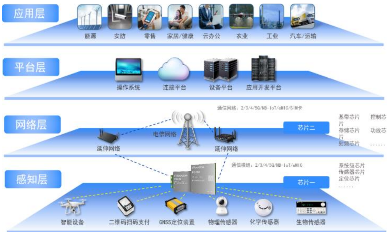
图 1：物联网产业链及架构

公司自成立以来一直致力于物联网与移动互联网无线通信技术和应用的推广及其解决方案的应用拓展，在通信技术、射频技术、数据传输技术、信号处理技术上形成了较强的研发实力，是无线通信技术领域拥有自主知识产权的专业产品与方案提供商。公司在物联网产业链中处于网络层，并涉及与感知层的交叉领域，主要从事无线通信模块及其应用行业的通信解决方案的设计、研发与销售服务。