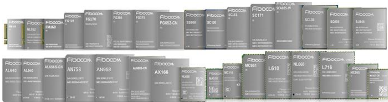
图 2：公司主要产品图片

公司自成立以来一直致力于物联网与移动互联网无线通信技术和应用的推广及其解决方案的应用拓展，在通信技术、射频技术、数据传输技术、信号处理技术上形成了较强的研发实力，是无线通信技术领域拥有自主知识产权的专业产品与方案提供商。公司在物联网产业链中处于网络层，并涉及与感知层的交叉领域，主要从事无线通信模块及其应用行业的通信解决方案的设计、研发与销售服务。