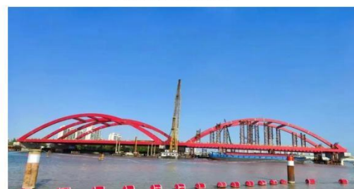
图例：苏州胜浦大桥