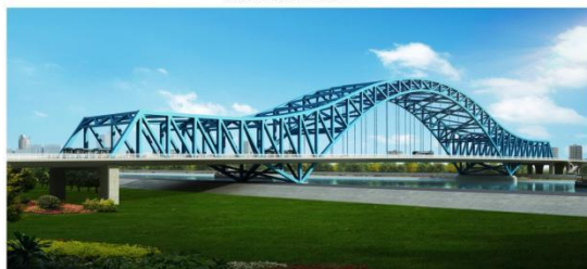
图例：泗阳成子河公路大桥