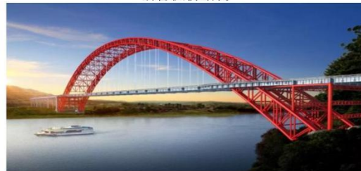
图例：四川犍为岷江特大桥