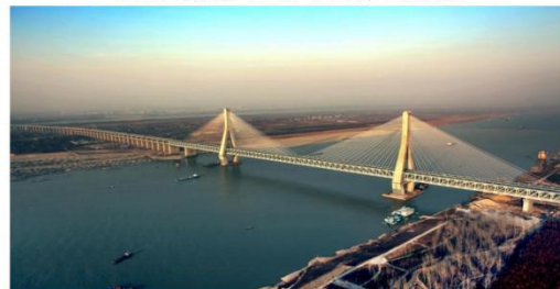
图例：天兴洲长江大桥