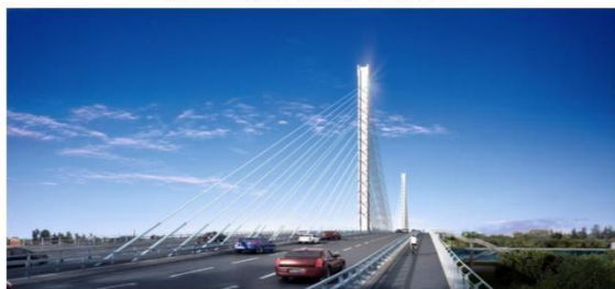
图例：上海柳港大桥