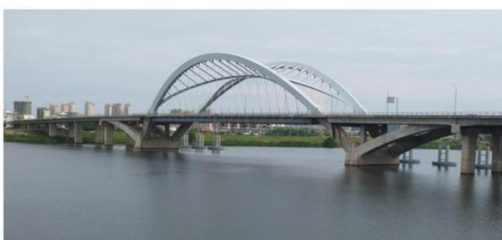
图例：鹰潭市余信贵大桥