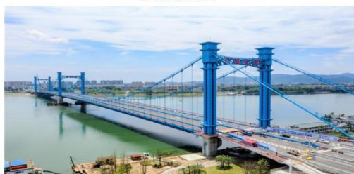
图例：襄阳凤雏大桥