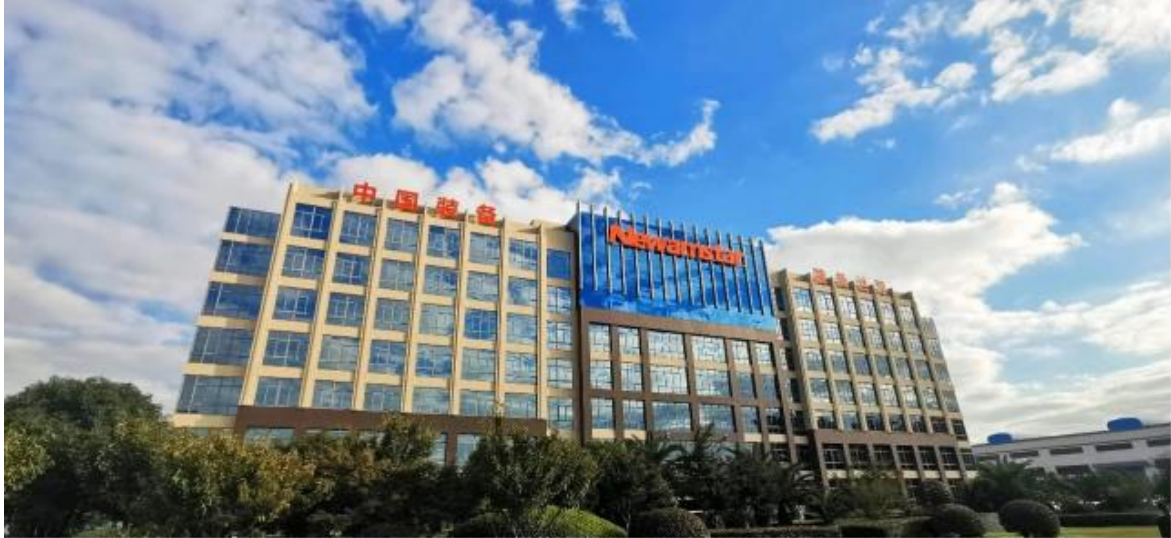
公司主要产品介绍：

公司主营业务为液体包装机械的研发、生产与销售，目前主要产品为前处理系统、吹灌旋一体机、吹瓶系统、灌装系统以及二次包装系列设备，能够为客户提供液体包装全面解决方案。近年来，公司以“振兴民族工业”为己任、以“帮客户建设理想工厂、助员工实现人生梦想”为使命，以高附加值、智能化的液态食品包装机械产品的研发、生产与销售为主业，充分发挥技术优势、品牌及客户优势、液态食品包装一体化全面解决方案优势、多应用领域优势、产品高性价比等竞争优势，为客户提供智能化、高性能、高附加值的产品。