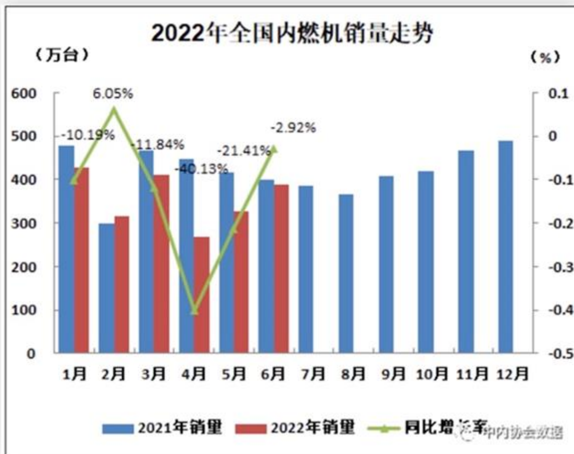
2022 年全国内燃机销量走势图

(2) 主要业务：公司全资子公司康跃（山东）主要从事涡轮增压器产品的研发、生产及销售。