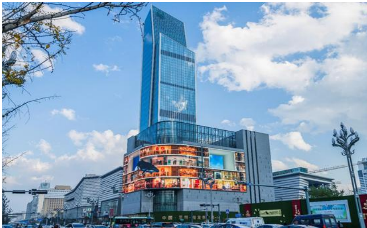
昆明金格百货户外大屏（A1699）