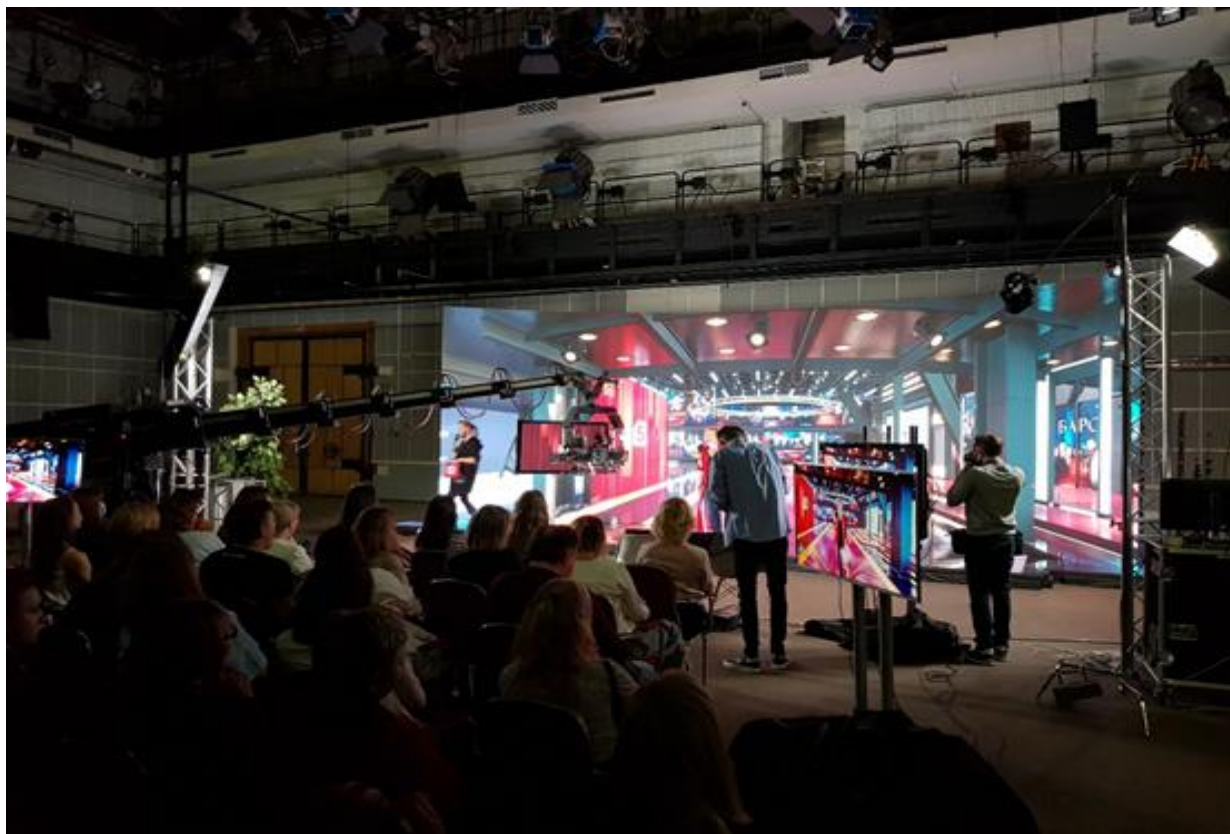
俄罗斯第五电视台摄影棚 (D2V)