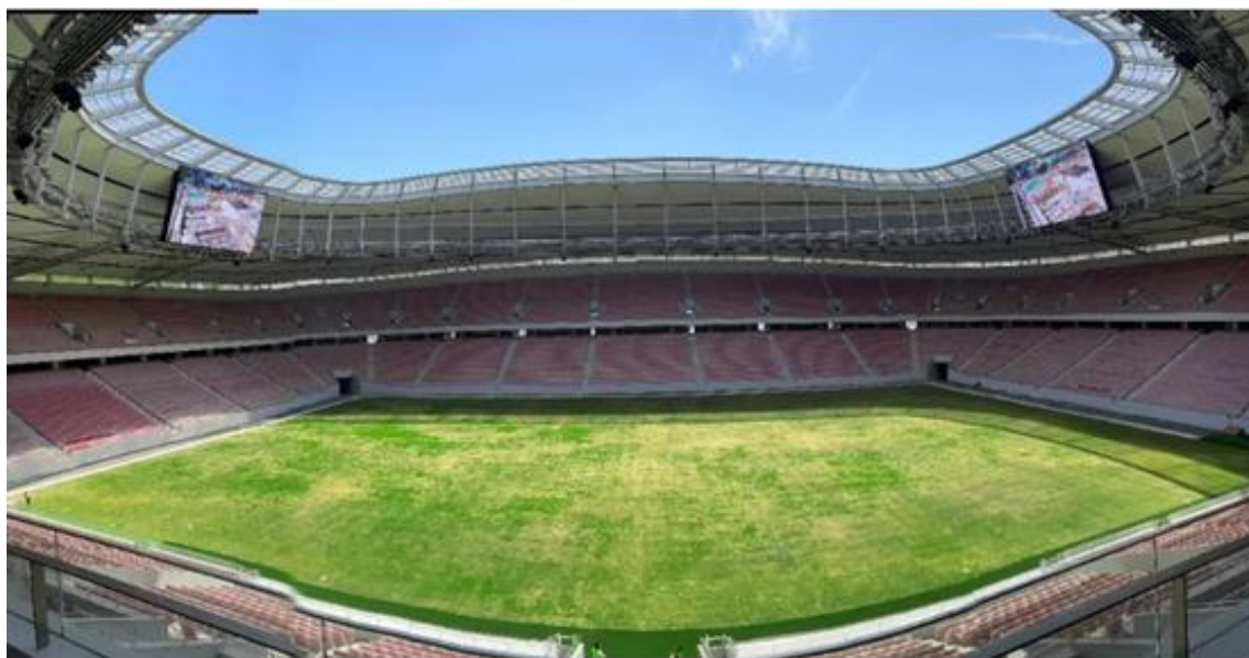
艾比森大屏在上汽浦东足球场点亮（XD8）