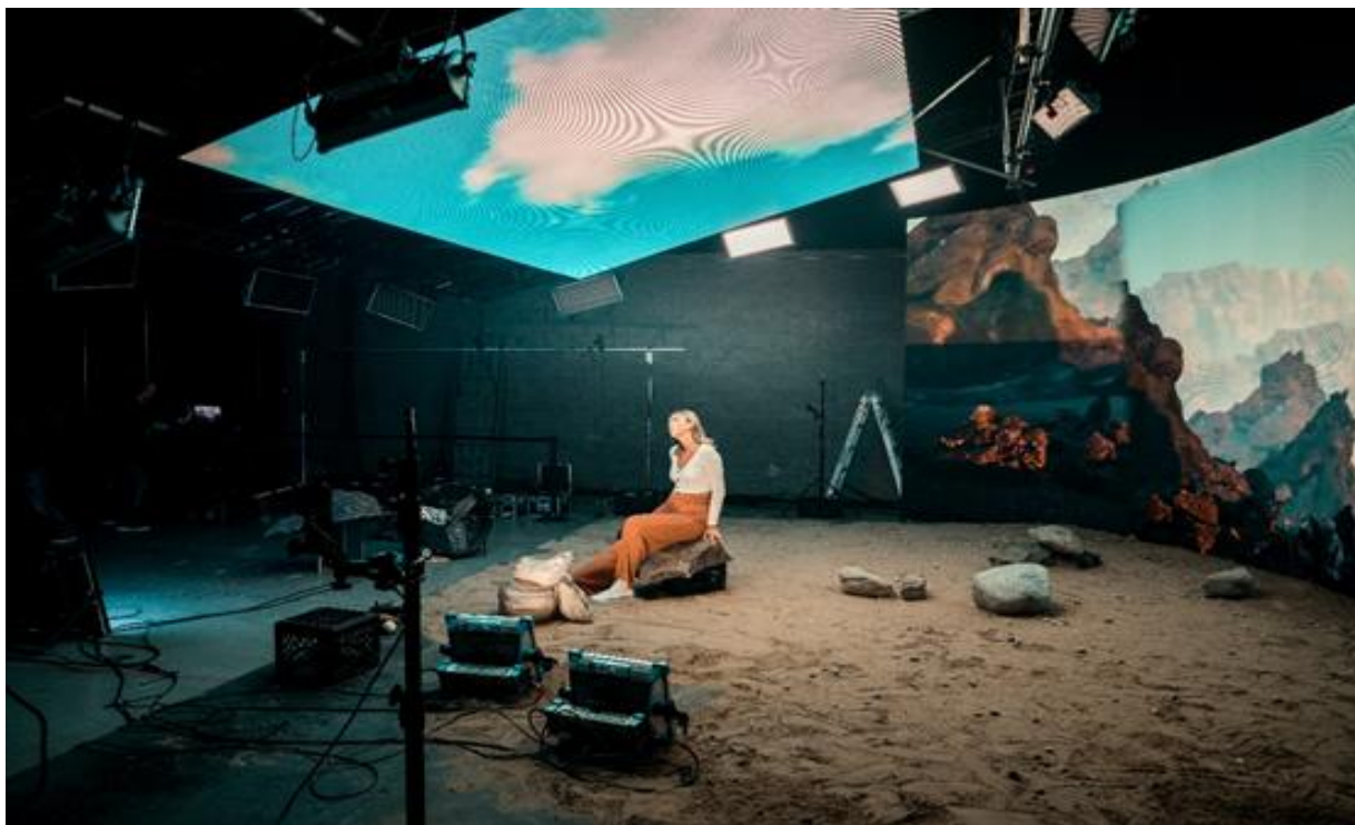
加拿大Grande Studios (M2.9)