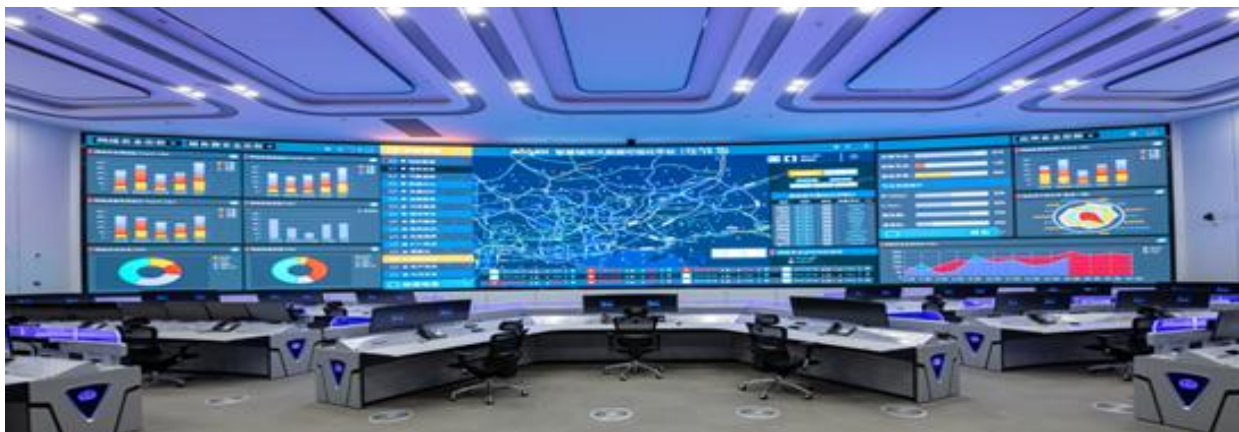
苏州市公安轨道应急指挥中心 (HC1.2)