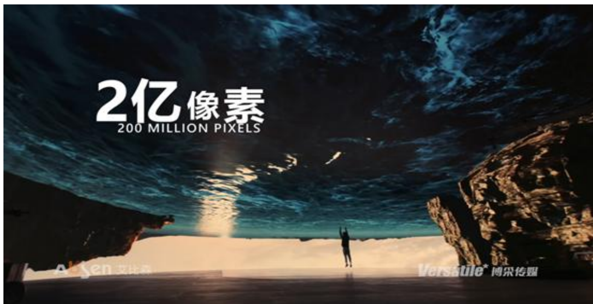
杭州博采虚拟摄影棚项目1期（P2）