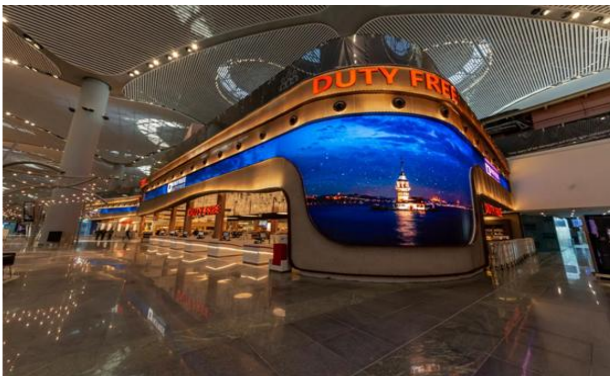
伊斯坦布尔机场免税店（N2.5）