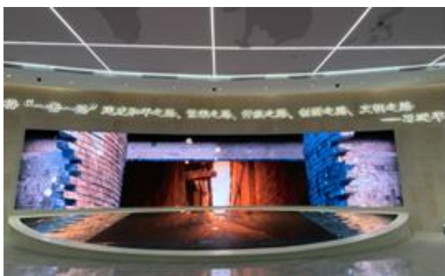
中国铁路西安局集团西安站服务中心 (KL1.5)