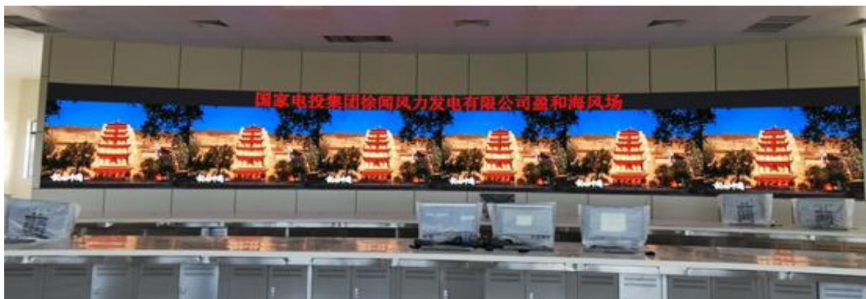
国家电投集团徐文风力发电公司（HC1.2）

辽宁财贸学院一次性采购艾比森106台KLicon系列智能会议屏，目前已正式交付投入使用。相较于传统的教学传播方式，LED显示屏借助互联网技术让教育资源打破了时间与空间的限制，不仅提升了优质资源的利用效率，还带来了丰富的教学形式，例如智慧互动式课堂、宣传大屏、校园活动舞台背景等，从小学到高校、户外到室内，为在校师生带来神奇的视觉体验，增加教学趣味性的同时，不断提升教学的质量。