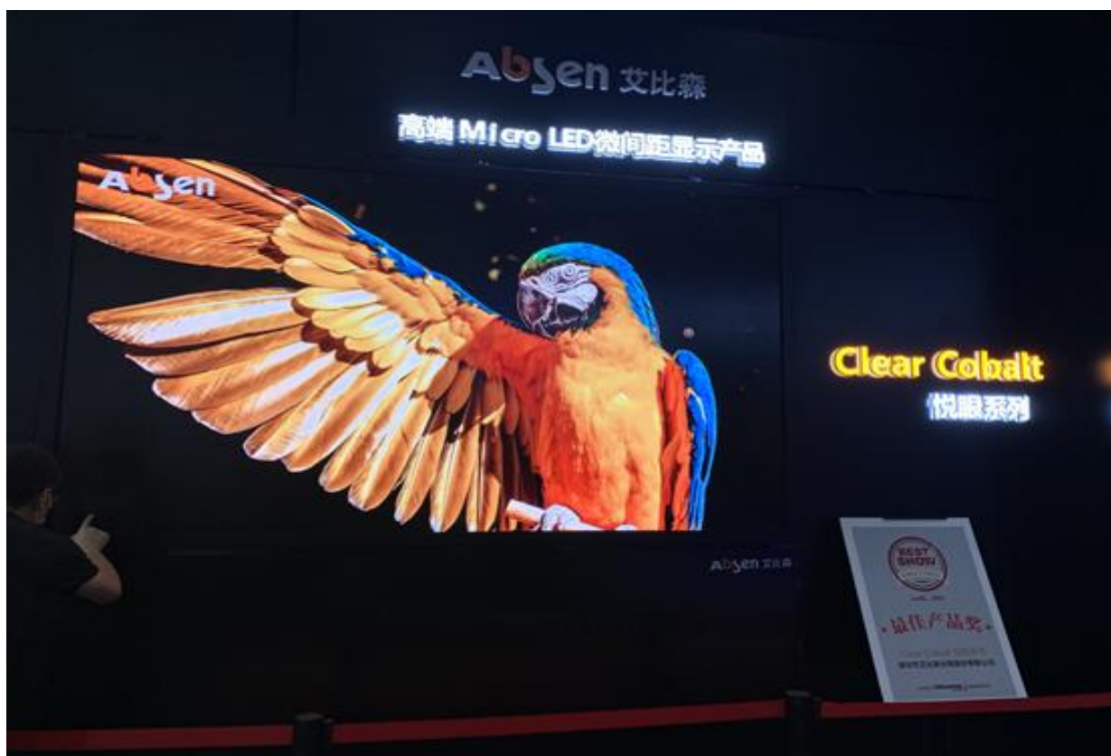
北京infocomm展（Micro LED 2K，悦眼系列）