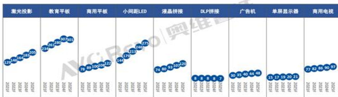
2021F-2025F年中国大陆商显分品类规模-亿元

注：如上图所示，在商业显示领域，对比其他的方案，LED显示展现了更大的活力和成长性。