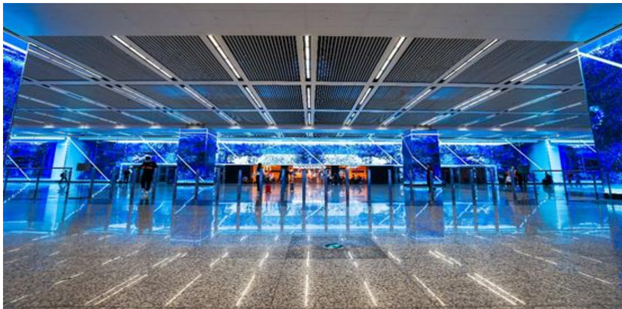
上海虹桥枢纽奥所未来城（KL3）

2018年公司开始立项开发LED裸眼3D大屏相关的产品，并整合了国内外顶尖的创意视频设计公司一起提供完整的解决方案。继2019年碧桂园潼湖科技小镇、2020年上海虹桥机场、广州佳兆业城市广场等网红地标之后，今年上半年公司广告产品线XD系列又打造出六安、洛阳、成都等地的LED 裸眼3D大屏，以及诸多创意视频素材的解决方案，为客户提供从硬件、到视频、到设计的多元化裸眼3D显示解决方案服务。