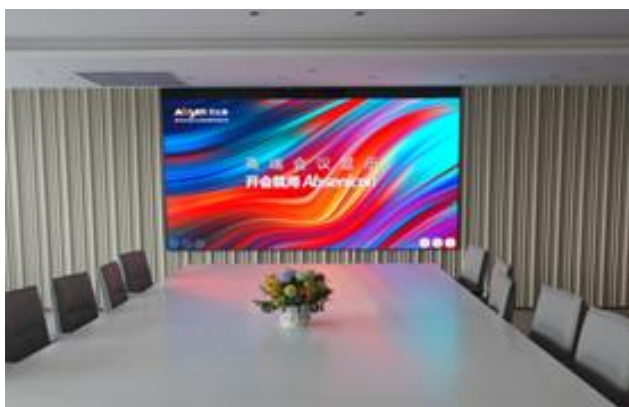
香港政府贸易发展局上海办事处（Absenicon C138）