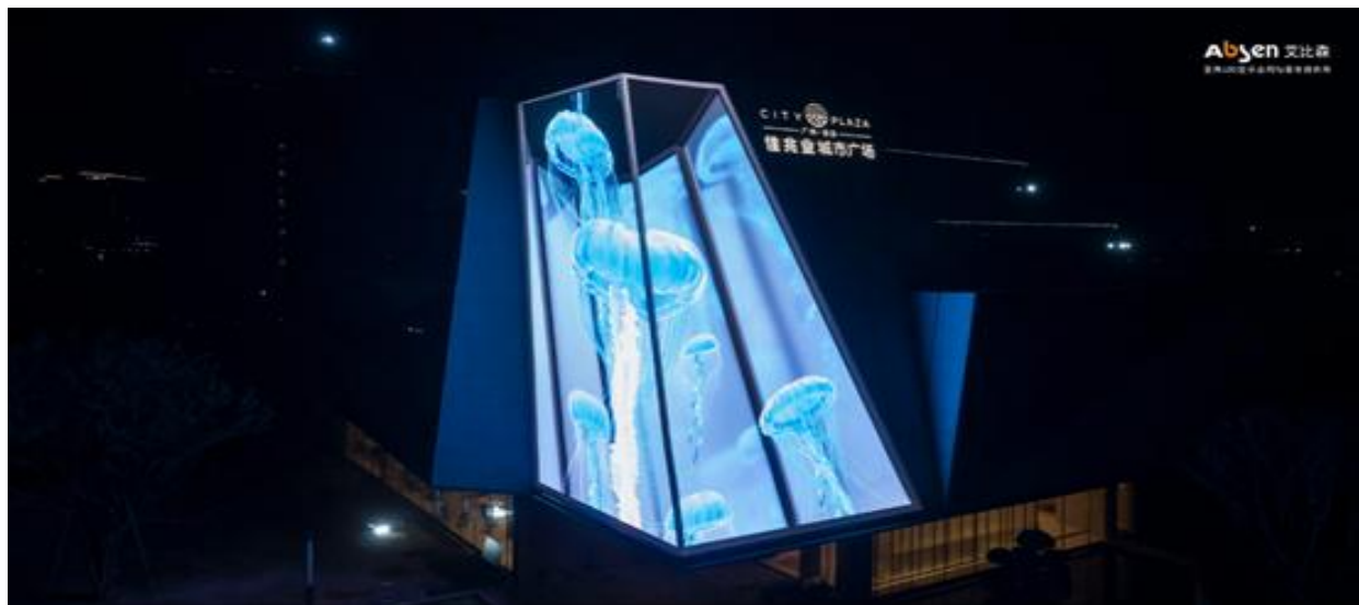
广州佳兆业城市广场户外大屏（GS5.9 Plus）