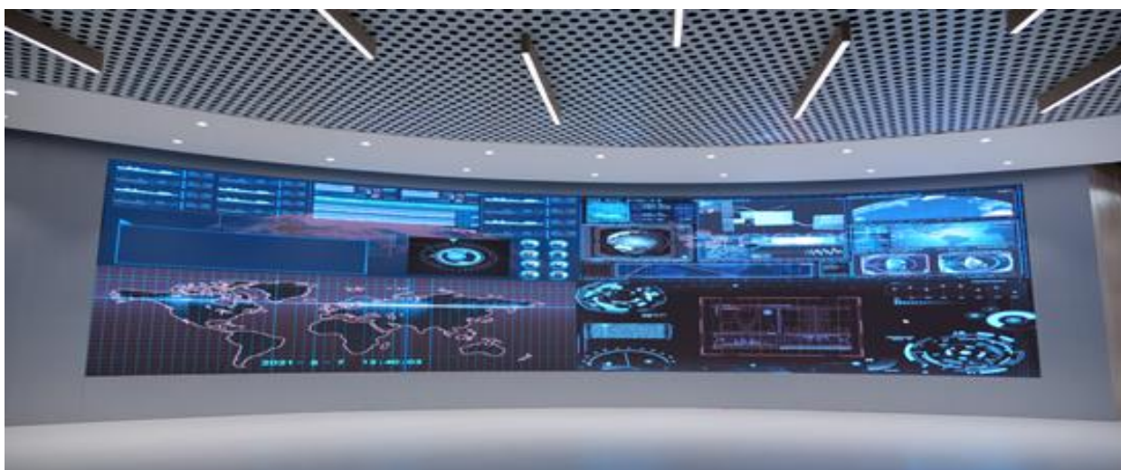
山东浪潮企业展厅(KL2)