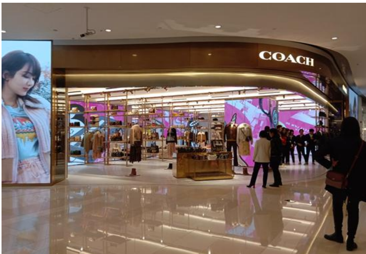
上海IAPM商场Coach国内最大的旗舰店（N3 Plus）