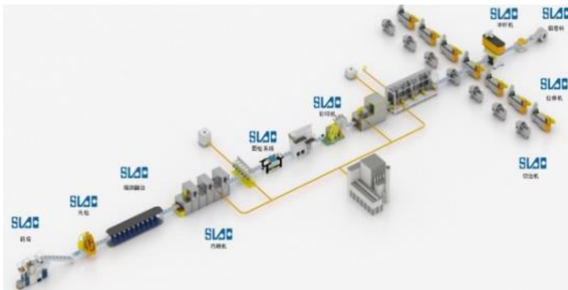
易拉罐高速生产线

易拉罐高速生产设备即将铝材通过多次精密加工工艺生产出易拉罐产品的设备。2015 年以来，公司凭借在易拉盖高速生产线领域积累的技术优势、客户优势，研发并实现销售易拉罐整线生产设备，打破了国外企业在此领域长期垄断的局面。为顺应国内外终端市场对易拉罐产品的消费需求，公司主要研发生产二片罐易拉罐整线设备。相较于传统的三片罐制品，二片罐制品具有密封性好、生产效率高、节省原材料等优势，但对于生产设备的技术要求也更高。目前，公司生产的高速易拉罐生产线的主要设备已经开发成熟，达到了世界先进水平，能够保证生产线的稳定性和良品率。