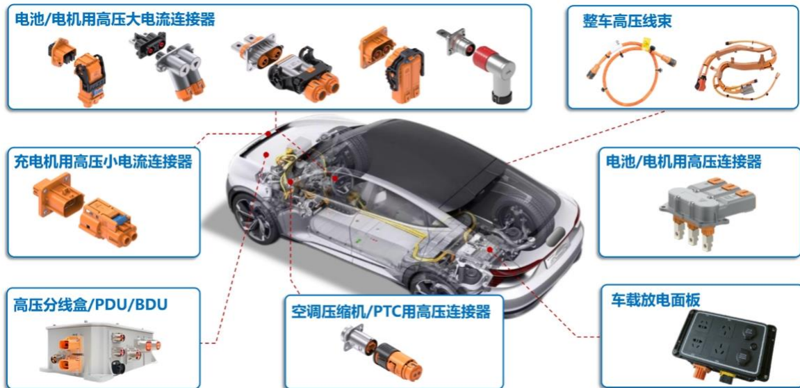
公司新能源充电产品应用示例