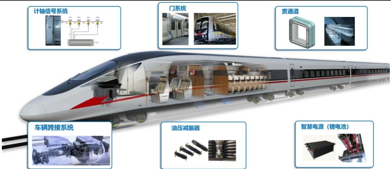
公司工业产品应用示例