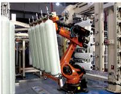
玻璃钢桶自动化生产线