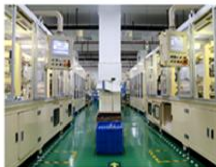
滤芯自动化生产线