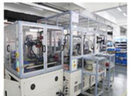
控制阀自动化生产线