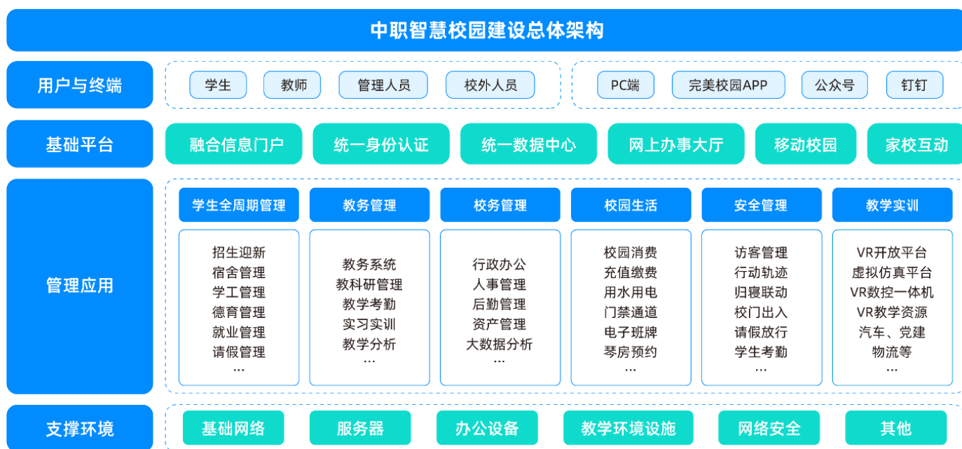
图三：中职智慧校园建设总体架构