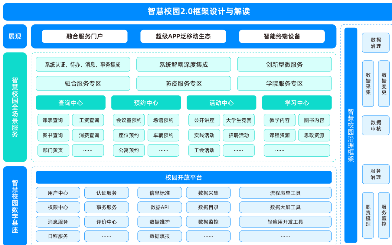
图一：智慧校园2.0框架设计与解读