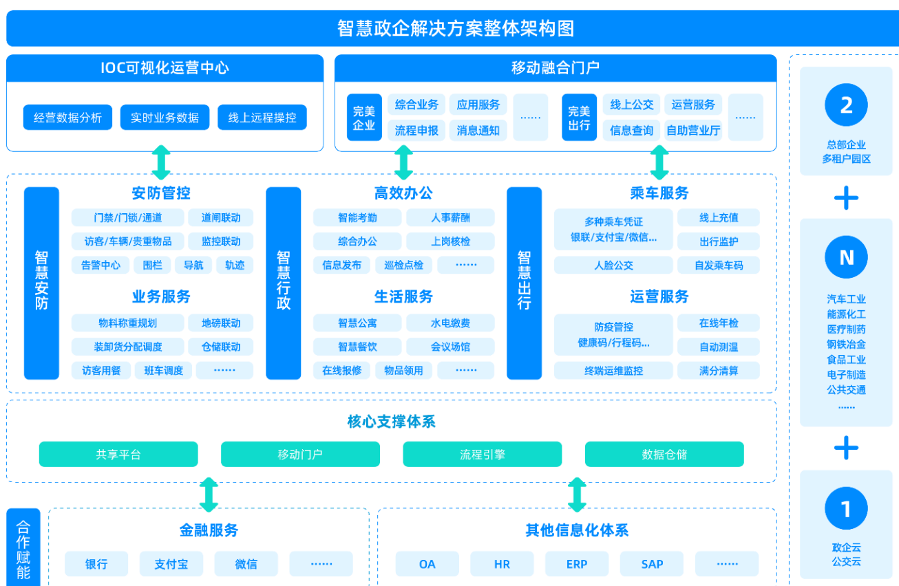
图五：智慧政企解决方案整体架构图