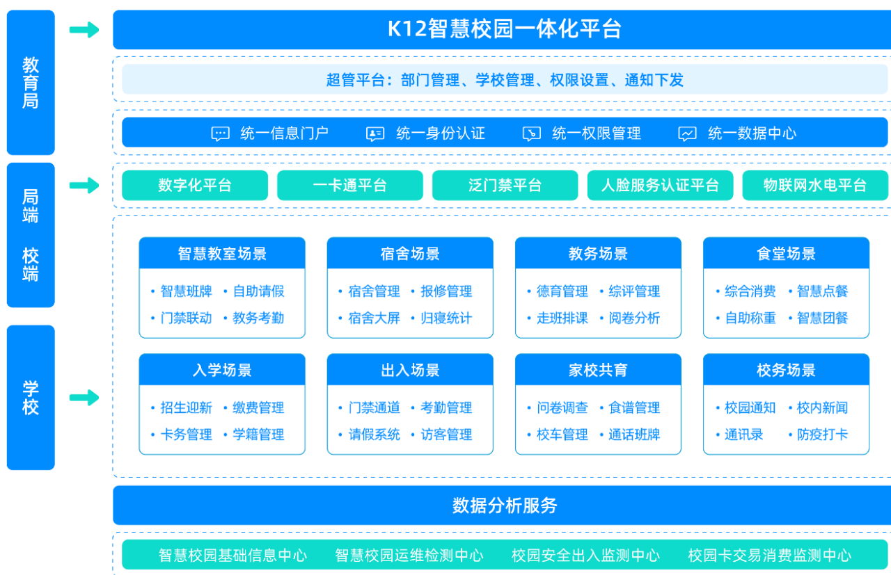
图二：K12智慧校园一体化平台

近两年，K12业务团队基于高校一卡通平台、缴费系统、门禁系统、水电控，以及消费机、通道机等智能终端产品，结合K12特色业务场景，进行二次开发，做了创新应用，如一体化综合管理服务平台、数据聚合展示平台、幼儿园通道管理系统、通话电子班牌系统、校园班车系统、可视化放学系统、迎新系统、学籍管理系统、德育管理系统、综合素质评价系统、宿舍管理系统、报修系统、手机端轻应用系统、银行产品合作创新等，一方面丰富了解决方案内容，满足客户更多需求，另一方面增强了公司产品竞争力。此外，也支撑了公司大订单的项目交付，提高了公司的议价能力。