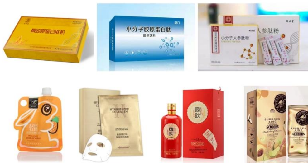
图 3 原料类胶原蛋白部分应用领域