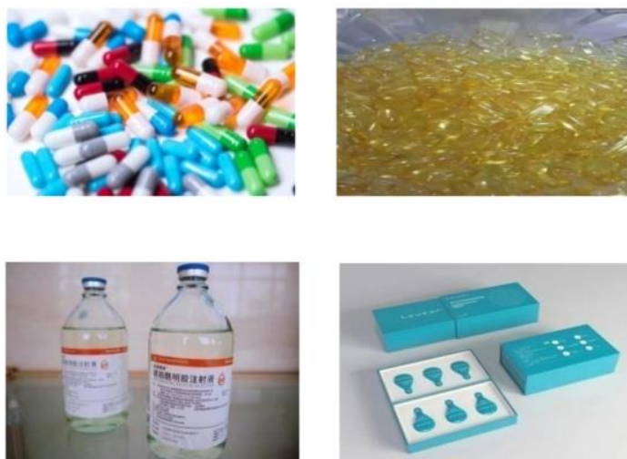
图 1 明胶(代血浆明胶)、胶囊在药用辅料、医用领域应用