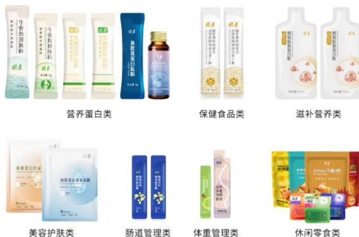
图 4 终端系列产品