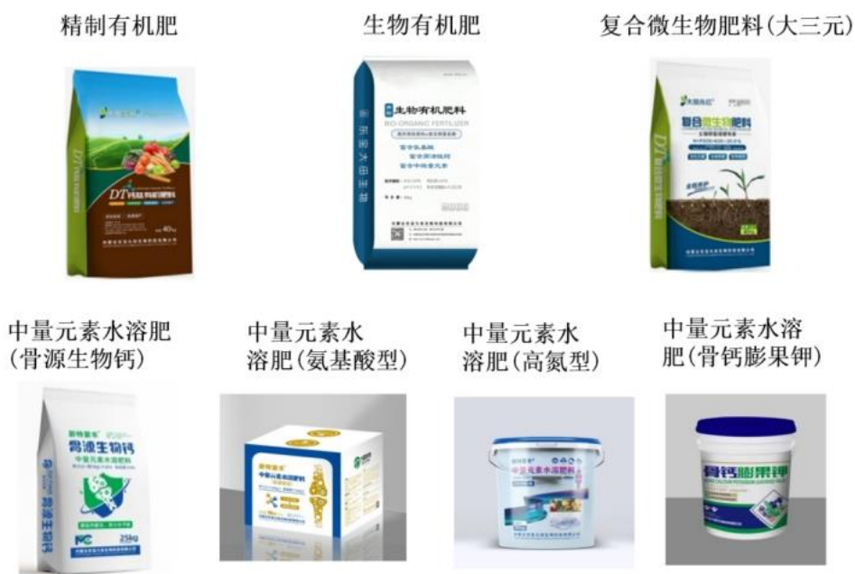
图 5 肥料类产品

大田公司的肥料类产品具有富含“活性钙”和“小分子肽”的独特优势，能够更好地满足农作物生产所需的营养需求，可广泛适用于大棚温室、有机农业、大田生产等，具有改良土壤和提高作物产量品质等肥效(详见图 5)。