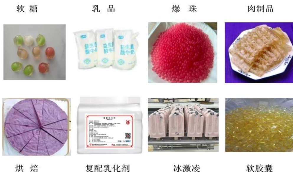
图 2 明胶部分应用领域

在营养健康领域，公司 TO B 端业务产品中，明胶广泛应用于糖果(包含软糖)、乳品、爆珠、肉制品、烘焙、复配乳化剂、饮料、冰激凌、软胶囊等保健品/营养健康食品领域(详见图 2)；胶原蛋白广泛应用于功能食品、保健食品(口服液、固体饮料等)、宠物营养食品(湿粮罐头)、工业领域(电镀铜箔、纺织品、纸浆)、医美生美(药膏剂型、化妆品)等领域(详见图 3)。