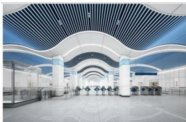
乌鲁木齐地铁1号线

公司陶瓷涂料可达到A1级防火等级及9H超高硬度，产品采用全水性绿色环保体系，具有低VOC排放、阻燃、抗菌、耐沾污、自清洁等特点，产品技术达到国内先进水平，可广泛应用于建筑外墙、室内装饰、窗门型材的涂装，在地铁站、高铁站、隧道、医院等公共建筑中具备广阔的应用前景。