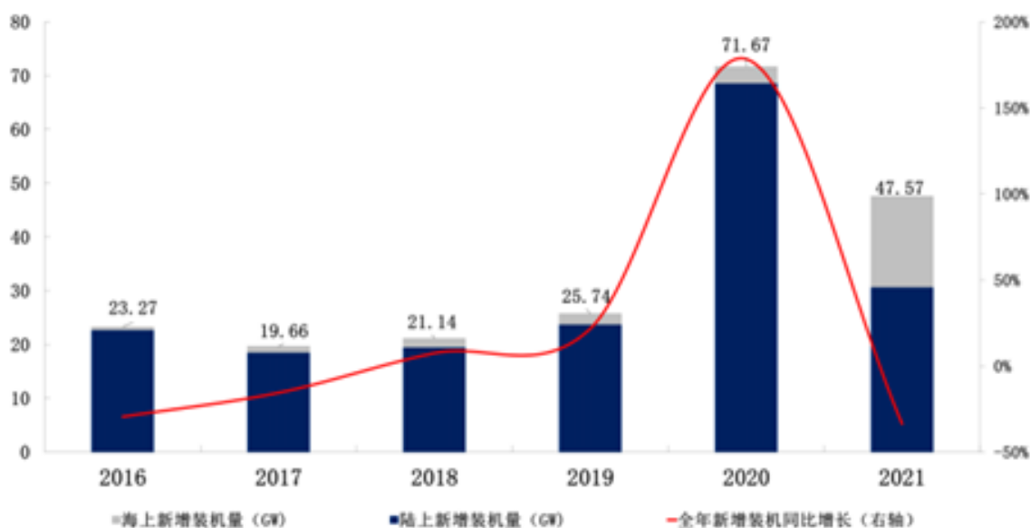
图：历年来中国风电新增并网容量及同比增速（GW）

风力发电具有蕴藏量大、可再生、分布广、无污染、技术成熟、良好的经济性特性等特点，是最成熟的清洁能源利用形式之一。近年来，风电作为新能源行业，支持可再生能源发展、提高清洁能源在国家能源结构中的比例，已经是全社会的共识与我国政府的政策导向。根据全球风能理事会（GWEC）发布的2022年全球风电行业报告，2021年，全球风电装机新增93.6GW(并网容量)，累计装机量达到837GW(较上一年增长12%)。其中2021年全球陆上风电新增装机72.5GW，中国及美国这两个全球最大风电市场的陆上风电新增安装量有所下降，分别为30.7GW和12.7GW，我国装机占比42.34%。但欧洲、拉丁美洲、非洲及中东的陆上新增装机分别增长了19%、27%及120%，纷纷创造历史新高。全球海上风电在2021年实现了21.1GW的新增并网(为2020年的三倍多)，创造了历史最好成绩。我国海上风电新增装机占全球的80%，超越英国成为全球海上风电累计装机最多的国家。