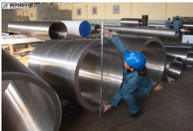
超大直径双相不锈钢无缝钢管

2014年，公司完成收购中兴装备100%股权事宜，公司的主营业务新增了能源工程特种管件业务。中兴装备是我国能源工程特种管件行业的领军企业，也是我国能源工程用不锈钢无缝管特种管件产品规格最全、外径最大、壁厚最大的生产企业之一，并在石化、核电、煤化工、新兴化工等领域具有较强的市场竞争力和较高的市场占有率。