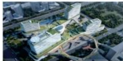
盐城市第一人民医院二期及医疗综合体