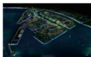
山东裕龙石化项目