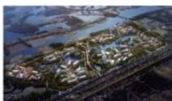
华为上海青浦研发生产项目