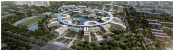
西交利物浦大学太仓校区项目