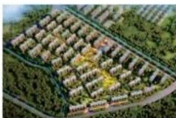
■ 南京中骏原理阁装配式项目(PC)