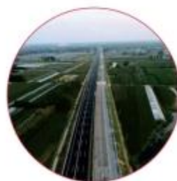
■ 京沪高速改扩建 Sy4标