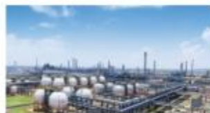
盛虹炼化一体化项目