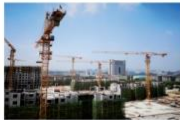
■ 南京熙园府装配式项目(PC)