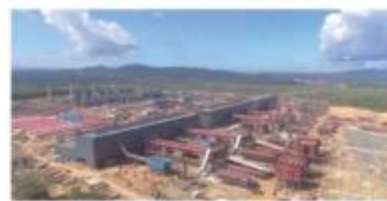
▲ 印尼苏拉威西岛莫罗瓦里县镍铁厂