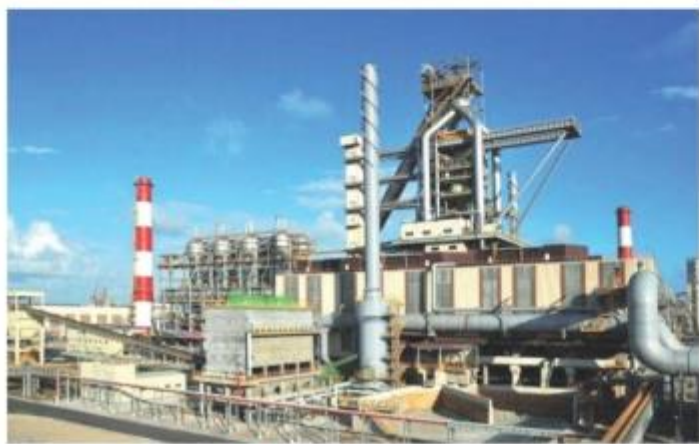
▲ 越南台塑河静1、2号高炉