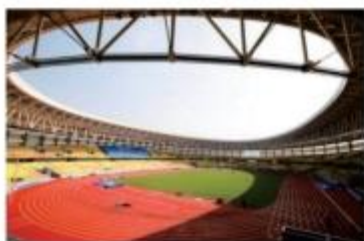
■ 武汉东西湖五环体育馆预制清水看台板项目