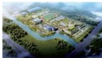
太仓市城东水质净化厂项目