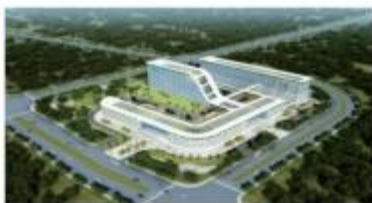
苏州市妇幼保健院项目