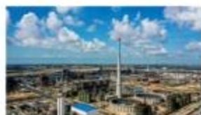
中科(广东)炼化一体化项目