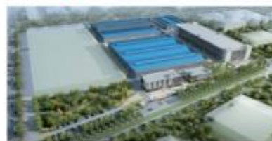
▲ 印尼三宝壟PVC管厂房建设开发项目