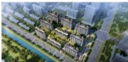
灌云万达广场泰达城