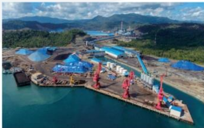
▲ 印尼宾坦南山工业园项目