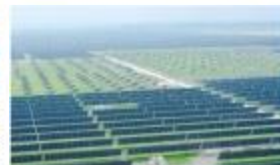
国家光伏·储能实证实验平台(大庆基地)一期工程项目