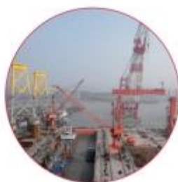
■ 江苏海新船务重工有限公司轨道安装项目