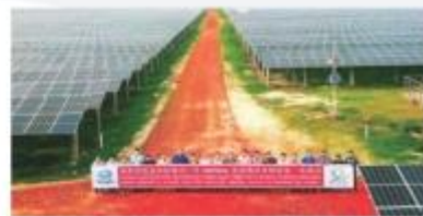
▲ 孟加拉国迈门辛市50MWac光伏项目