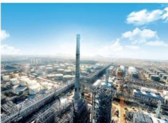
浙石化年产4000万吨炼化一体化项目