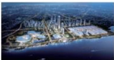
厦门新会展中心体育中心