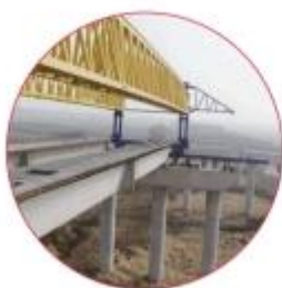
■ 徽州大道南延工程(庐江段)