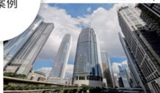
越秀地产雨花95亩G40项目 |