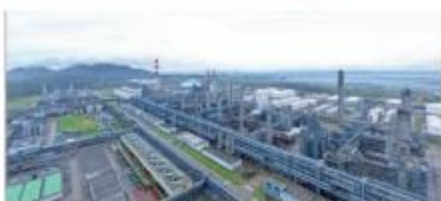
福建古雷炼化一体化项目