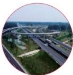
■ 阜溧高速公路建湖至兴化段