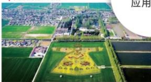
| 中铁六合龙袍新城项目