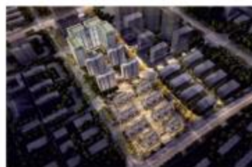
■ 武汉蔡甸中法之星一期装配式项目(PC)