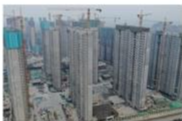
■ 招商东望府装配式项目(PC)