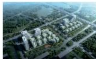
上海宝山MAX科技园项目