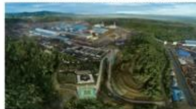
▲ 印尼青山镍业工业园