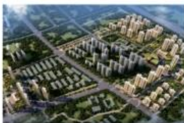
■ 武汉蔡甸中法生态城新天地还建区装配式项目(PC)