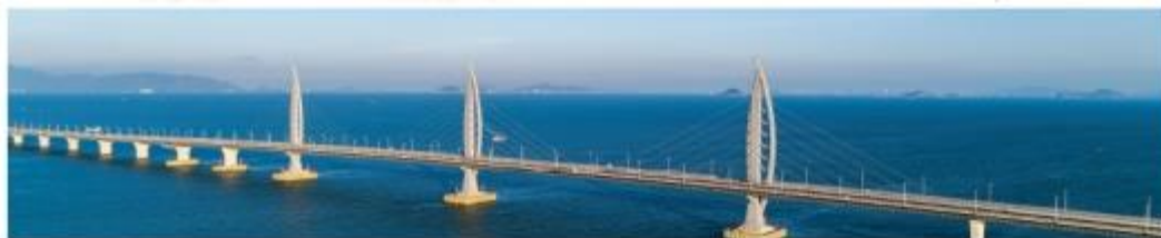
■ 港珠澳大桥工程项目