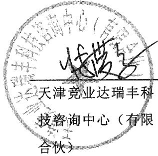
天津竞业达瑞丰科技 咨询中心(有限 合伙)