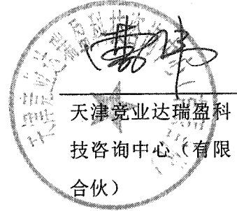
天津竞业达瑞盈科技 咨询中心(有限 合伙)